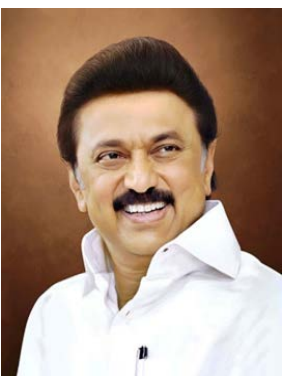
தமிழ்நாடு முதலமைச்சர் அவர்கள் வேளாண்மைத் துறைக்கு முக்கியத்துவம் அளித்தும் வகையில், வேளாண் பெருங்குடி மக்களின் வரு