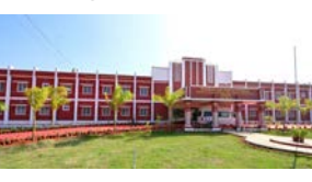
வாயினை பன்மடங்கு உயர்த்திவரும், நிகர சாகுபடிப் பரப்பினை அதிகப்படுத்தும் பொருட்டுப் பல்வேறு திட்டங்களை அறிவித்து சிறப்பாக செயல்படுத்தி வருகிறார்கள். வேளாண் துறையின் எதிர்காலத் தேவைகளை மேற்கொள்ளும் பொருட்டு, பல்வேறு ஆராய்ச்சிகளுக்கும் முக்கியத்துவம் அளித்தும் வகையில் திட்டங்கள் செயல்படுத்தப்பட்டு வருகிறது. ஆகையால்தான் வேளாண் துறை என்பதை வேளாண்மை - உழவர் நலத்துறை எனப்பெயர் மாற்றப்பட்டு இத்துறையின் முக்கியத்துவம் உணர்ச்சியடையப்பட்டு இருந்தது.

குறிப்பாக, வேளாண் துறையின் எதிர்காலத் தேவைகளை பூர்த்தி செய்தற்கு ஏதுவாக பல்வேறு ஆராய்ச்சிகளை மேற்கொள்ளுவதில் தமிழ்நாடு வேளாண்மைப் பல்கலைக் கழகம் முக்கிய பங்கு வகித்து வருகிறது.