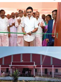
நிலையத்தில் இளங்கலை வேளாண் அறிவியலில் மூன்றாம் ஆண்டு பயின்று வருகிறேன்.

எங்களது கல்லூரியின் கட்டுமானப் பணிக்கு கடந்த 2023 ஆம் ஆண்டு அடிக்கல் நாட்டப்பட்டு, பற்போது அனைத்து பணிகளும் நிறைவு பெற்று மாண்புமிகு தமிழ்நாடு முதலமைச்சர் அவர்களால் 31.1.2026 அன்று நேரில் திறந்து வைக்கப்பட்டது மேலும் பெருமைக்குரிய ஒன்றாகும்.