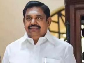
யின் கேள்வியில் வைத்து பாலியல் வன்கொடுமைக்கு ஆளாக்கப்பட்டுள்ளாரே, என்பது குறித்து கேட்டால் அப்படி ஒரு சம்பவம் நடந்திருப்பதே தெரியாது என்கிறார் அமைச்சர் மா.சுப்பிரமணியன். அக்கறையற்ற அமைச்சரின் பேச்சு வேதனைக்குரியது

யல் குற்றங்களின் எண்ணிக்கை அதிகரித்து வருவதை இந்த முதல் அமைச்சர் மு.க.ஸ்டாலின் வேடிக்கை பார்த்து வருவது வெட்கக்கேடானது. சென்னையில் நேற்று பீகாரைச் சேர்ந்த இளம் பெண் ஒருவர் பாலியல் வன்கொடுமைக்கு ஆளாகப்பட்டுள்ளாரே, என்பது குறித்து கேட்டால் அப்படி ஒரு சம்பவம் நடந்திருப்பதே தெரியாது என்கிறார் அமைச்சர் மா.சுப்பிரமணியன். அக்கறையற்ற அமைச்சரின் பேச்சு வேதனைக்குரியது