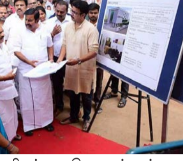
நிறுத்த வசதி, தரைத்தளத்தில் பேரிடர் மேலாண்மைத் துறை உபகரணங்கள் வைப்பு அறைகள், முதல் மற்றும் இரண்டாம்

கக் கட்டடத்திற்கான பணியினை இன்று (29.01.2026) அடிக்கல் நாட்டித் தொடங்கி வைத்தனர். இந்த புதிய மண்டல அலுவலகம் கட்டடமானது 8,798 சதுர மீட்டர் பரப்பளவிடையுள்ள, தரைத்தளத்தில் பேரிடர் மேலாண்மைத் துறை உபகரணங்கள் வைப்பு அறைகள், முதல் மற்றும் இரண்டாம்