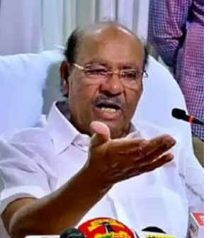
கொன்றதாக கொலையாளிகள் வாக்குமூலம் அளித்துள்ளனர். ஆனால் பஞ்சம் பிழைக்க வந்த வெளிமாநிலத்தவரையும் விட்டு வைக்காத மதுபோதை ஒரு குடும்பத்தையே நிர்மூலமாக்கியுள்ளது. பெண்கள் அச்சமின்றி வாழ இயலாது மதுவை அறவே ஒழிக்க அரசு மது கடைகளை நிரந்தரமாக மூட நடவடிக்கை எடுக்க வேண்டும். இவ்வசங்களை அளிக்க மது வருவாயை தவிர்த்து வேறு வகையில் வருவாயை பெற பல வழிகள் உள்ளன என தெரிவித்து உள்ளார்.

அருந்திவிட்டு பெண்ணை அடையதடையாக இருந்த குழந்தையை கொன்று பின் அப்பெண்ணையும் கொன்றதாக அக்கதை முடியும். ஆக மது அனைத்தையும் செய்ய வைக்கும் என்பதே இக்கதையின் சாராம்சம். அண்மையில் தஞ்சையில் நடைபெற்ற தி.மு.க. மகளிர் மாநாட்டில் பேசிய முதல் அமைச்சர் மு.க. ஸ்டாலின் பெண்களுக்கு பாதுகாப்பான சூழல் உருவாக்கியதால்தான் தமிழகத்தில் அதிக அளவிலான பெண்கள் தொழிற்சாலைகளில் பணியாற்றுகிறார்