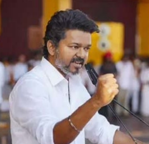
கொஞ்சம் கூட மனசாட்சியே இல்லாமல் பெண்களுக்கு பாதுகாப்பான மாநிலம் தமிழ்நாடு என்றும், எந்தக் கொடூரமான லும் குறை சொல்ல முடியாத ஆட்சி என்றும் வாழ்க்கைமலம் பொய்யையே திரும்பத்திரும்பக் கூறி வருகிறார். ஆட்சியின் இறுதிக்கால நாட்களை எண்ணிக் கொண்டு இருக்கும் முதல்வர் அவர்கள், இனி இருக்கும் கொஞ்சம் நாட்களிலாவது சட்டம் ஒழுங்கைப் பாதுகாக்க, தேவையான நடவடிக்கைகளை எடுக்க வேண்டும். மக்களுக்கு எதிரான, மக்களுக்குக் கொஞ்சமும் வருவதாகப் பொதுமக்கள் குற்றம் சாட்டுகின்றனர். குற்றம் செய்யவில்லை ஈடுபட்டவர்களுக்குத் தண்டனை பெற்றுத் தர உடனடியாக உரிய நடவடிக்கை எடுக்க வேண்டும். இவ்வாறு அவர் பதிவிட்டுள்ளார்.

யல் குற்றங்களின் எண்ணிக்கை அதிகரித்து வருவதை இந்த முதல் அமைச்சர் மு.க.ஸ்டாலின் வேடிக்கை பார்த்து வருவது வெட்கக்கேடானது. சென்னையில் நேற்று பீகாரைச் சேர்ந்த இளம் பெண் ஒருவர் பாலியல் வன்கொடுமைக்கு ஆளாகப்பட்டுள்ளாரே, என்பது குறித்து கேட்டால் அப்படி ஒரு சம்பவம் நடந்திருப்பதே தெரியாது என்கிறார் அமைச்சர் மா.சுப்பிரமணியன். அக்கறையற்ற அமைச்சரின் பேச்சு வேதனைக்குரியது