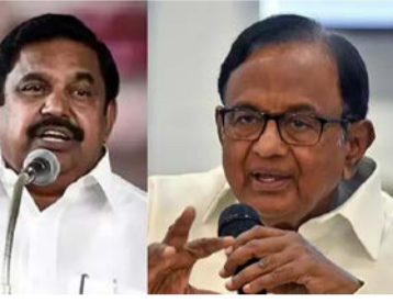
பேசப்பட்டது என்பதை பத்திரிகைகளில் பார்த்தேன். அதுகுறித்து இரண்டு கட்சித் தலைமைக

தலைவர்கள் அல்லது தலைமையில் இருப்பவர்கள் சந்தித்து பேசுவது, கெஞ்சுவது என்றால், காலில் விழுந்ததை என்னவென்று சொல்வது?" என்று பதிலடி கொடுத்தார். மேலும் அவர் கூறும் போது, "ஆட்சியில் பங்கு என்பது காங்கிரஸ் கட்சியில் ஒரு பொருளாக