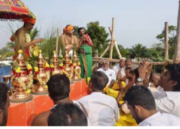
உள்ள கோபுர கலசத்தில் புனித நீர் ஊற்றி கும்பாபிஷேகம் நடைபெற்றது.

காப்பு கட்டுதலுடன் கும்பாபிஷேக விழா தொடங்கியது. பல்வேறு புனித தலங்களில் இருந்து கொண்டுவரப்பட்ட புனித நீர் யாக சாலையில் வைத்து பூஜை செய்யப்பட்டது. பூஜையின் நிறைவில் கடம் பூழ்ப்பாடு நடைபெற்றது. கருடன் வானில் வட்டமிட அம்பிகையில் ஆலயத்தில்