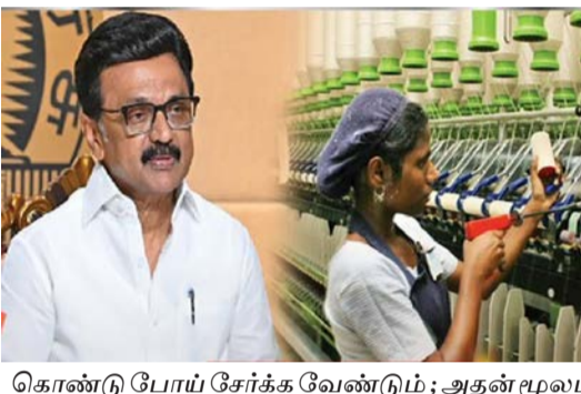
கொண்டு போய் சேர்க்க வேண்டும்; அதன் மூலம் இவ்வாறு அவர் கூறினார்.

கோவை, ஜன.30 கோவை கொடிசியா வளாகத்தில் நடைபெற்ற "ஐவுளி தொழில் மாநாடு 360" ஐ முதல் அமைச்சர் மு.க. ஸ்டாலின் காணொலி காட்சி வாயிலாக இன்று தொடங்கி வைத்தார். அதன்பின்னர் அவர் பேசியதாவது: ரூ.915 கோடி மதிப்பீட்டில் 55 புரிந்துணர்வு ஒப்பந்தங்கள் இம்மாநாட்டில் மேற்கொள்ளப்பட உள்ளன. அதுமட்டுமல்லாமல், தமிழ்நாட்டின் 'ஒருங்கிணைந்த புதிய ஐவுளிக் கொள்கை 2024' இன்று வெளியிடப்பட்டுள்ளது. தமிழ்நாடு ஐவுளித் துறையின் வலுவான கட்டமைப்பைப் பற்றி உலக வாடிக்கையாளர்களிடம்