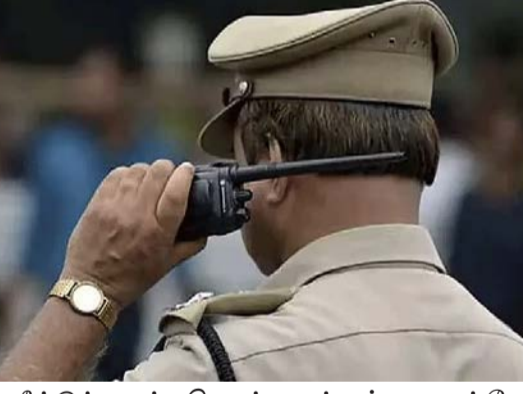
வீட்டுக்கு வந்து கொண்டிருந்தார். ஏரவாஞ்சேரி கிழக்கு அக்ரஹாரம் பிள்ளையார் கோவில்