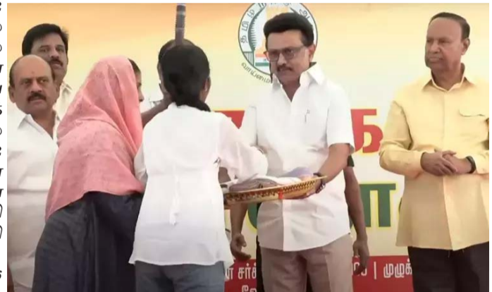
இதில், முதல் நாள் 200 குடும்ப அட்டைதாரர்களும், இரண்டாம் நாள் 300 முதல் 400 வரையிலான குடும்ப அட்டைதாரர்கள் பொங்கல் பரிசுத் தொகுப்பு பெறுவதற்கு ஏதுவாக தொடர்புடைய ரேஷன் கடைப் பணியாளர்களால் டோக்கன்கள் விநியோகம் செய்யப்பட்டது. இதற்காக சுமார் 50,000 கூட்டுறவுத்துறை பணியாளர்கள் பணியில் ஈடுபடுத்தப்பட்டுள்ளனர். பொங்கல் பண்டிகைக்கு முன்னதாக அனைத்து அரிசி பெறும் குடும்ப அட்டைதாரர்களுக்கும் பொங்கல் பரிசு வழங்கும் வகையில் பணிகள் நடைபெற்று வருகிறது.

தமிழ்நாடு முழுவதும் அனைத்து அரிசி குடும்ப அட்டைதாரர்கள் மற்றும் இலங்கை தமிழர் மறுவாழ்வு முகாம்களில் வசிக்கும் குடும்பத்தினர் ஆகியோர்களுக்கு 2026 பொங்கல் பரிசுத் தொகுப்பிற்கான பேக்கர்கள் குடும்ப அட்டைதாரர்களுக்கு 04.01.2026 முதல் 07.01.2026 வரை தொடர்புடைய ரேஷன் கடைப் பணியாளர்களால் வழங்கப் பட்டது.