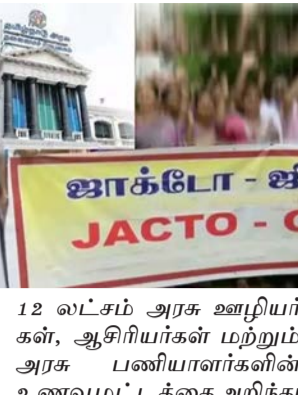
12 லட்சம் அரசு ஊழியர்கள், ஆசிரியர்கள் மற்றும் அரசு பணியாளர்களின் உணவுமட்டத்தை அறிந்து

வில்லை. கடந்த பிப்ரவரி 24 தேதி அமைச்சர்கள் கொண்ட குழு எங்களை அழைத்து பேசுவார்க்கு நடுத்தியது. அதேபோல் மார்ச் 13 தேதி முதல் அமைச்சர் பேச்சுவார்த்தை நடத்தி 10 அம்ச கோரிக்கைகள் குறித்து விரிவாக பேசி நம்பிக்கை அளித்தார். அதன் அடிப்படையில்