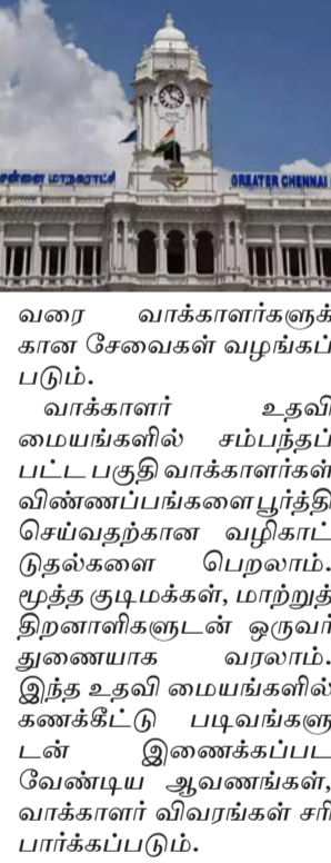
வரை வாக்காளர்களுக்கான சேவைகள் வழங்கப்படும். வாக்காளர் உதவி மையங்களில் சம்பந்தப்பட்ட பகுதி வாக்காளர்கள் விண்ணப்பங்களை பூர்த்தி செய்வதற்கான வழிகாட்டுதல்களை பெறலாம். மூத்த குடிமக்கள், மாற்றுத் திறனாளிகளுடன் ஒருவர் துணையாக வரலாம். இந்த உதவி மையங்களில் கணக்கீட்டுப் படிவங்களுடன் இணைக்கப்பட வேண்டிய ஆவணங்கள், வாக்காளர் விவரங்கள் சரிபார்க்கப்படும்.

தொகுதிகளிலும் வாக்குச்சாவடி நிலை அலுவலர்கள் வீடு, வீடாக சென்று வாக்காளர்களுக்கு கணக்கீட்டுப் படிவங்களை வழங்கி நிரப்பப்பட்ட படிவங்களை பெற்று வருகின்றனர். கணக்கீட்டுப் படிவங்களை பூர்த்தி செய்வதில் வாக்காளர்களுக்கு ஏற்படும் சந்தேகங்களுக்கு தீர்வுகளை வழங்கும் மற்றும் அவர்களது உறவினர் பெயர்கள் 2005ம் ஆண்டு வாக்காளர் பட்டியலில் இடம் பெற்ற விவரங்களை கண்டறிவதும் இன்று (செவ்வாய்க்கிழமை) முதல் 25 தேதி வரை 8 நாட்களுக்கு 947 வாக்குச்சாவடி மையங்களில் வாக்காளர் உதவி மையங்கள் செயல்படும் என மாலை 10 மணி முதல் மாலை 6 மணி