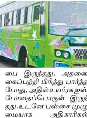
பை இருந்தது. அதனை கைப்பற்றி பிரித்து பார்க்க போது, அதில் உயர் ரக போதைப்பொருள் இருந்தது. உடனே பஸ்சை முழுமையாக அதிகாரிகள்

பி.பட்டினத்தை அடுத்த கலியநகரி கிராமத்தின் அருகே சோதனையில் ஈடுபட்டனர். புதுக்கோட்டையில் இருந்து தொண்டி நோக்கி வந்து கொண்டிருந்த தனியார் பஸ்சை மறித்து சோதனை செய்தனர். அந்தபஸ்சில் பயணிகள் உடைமெகள் வைக்கும் இடத்தில் சந்தேகப்படும் வகையில் ஒரு பாலித்தீன்