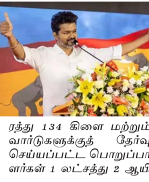
ரத்து 103 பேருக்கு கியூ.ஆர்.கோடு குறியீட்டுடன் கியூயடிட்டில் அடையாள அட்டை தவெக. தலைவர் விஜய் அறிவுறுத்தலின் பேரில் அந்தந்த மாவட்ட செயலாளர்களிடம் வழங்கப்பட்டு உள்ளது. இவ்வாறு அவர் கூறி உள்ளார்.

இதுவரை பல்வேறு கட்டங்களாக சுமார் 3 லட்சம் பொறுப்பாளர்கள் தேர்வு செய்யப்பட்டு உள்ளனர். இவர்களில் முதல் கட்டமாக தற்போது 106 மாவட்டங்களுக்கு உட்பட்ட 214 சட்டசபை தொகுதிகளில் உள்ள ஆயிரத்து 280 நகர, ஒன்றிய, பேரூர் கழகங்கள் மற்றும் அதை சார்ந்த 21 ஆயிரத்து 103 பேருக்கு கியூ.ஆர்.கோடு குறியீட்டுடன் கியூயடிட்டில் அடையாள அட்டை தவெக. தலைவர் விஜய் அறிவுறுத்தலின் பேரில் அந்தந்த மாவட்ட செயலாளர்களிடம் வழங்கப்பட்டு உள்ளது. இவ்வாறு அவர் கூறி உள்ளார்.