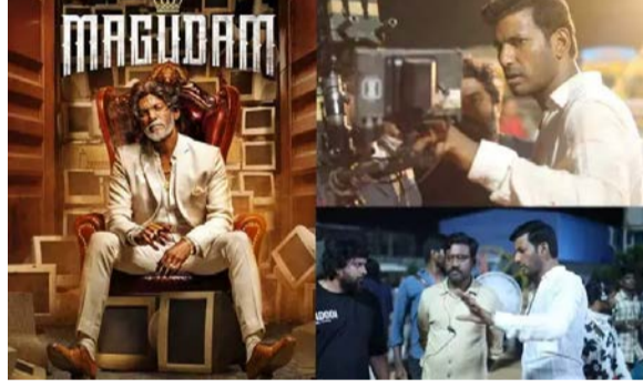
17 இரவுகள் இந்த படத்தின் கிளைமேக்ஸ் காட்சிகள் எடுக்கப்பட்டுள்ளன. இந்த நிலையில், நடிகர் விஷால் மகுடம் படத்தின் கிளைமேக்ஸ் காட்சியின் மேக்கிங் வீடியோவை வெளியிட்டுள்ளார்.