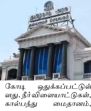
கோடி ஒதுக்கப்பட்டுள்ளது. நீர் விளையாட்டுகள், திகள் ஏற்படுத்தப்படுகிறது.

ணையை வெளியிட்டது. இதன்படி செம்மஞ்சேரியில் 112.12 ஏக்கர் பரப்பளவில் ரூ.301 கோடி மதிப்பீட்டில் பிரமாண்டமான விளையாட்டு நகரம் உருவாக்க திட்டமிடப்பட்டுள்ளது. இதற்கு ரூ.30