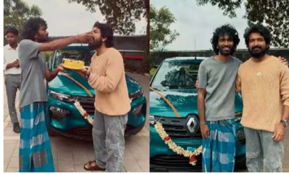
ரொம்பவும் நன்றி, லவ் யூ" என்று சொல்லி ஒரு முத்தமும் கொடுத்து காரை அன்பளிப்பாக கொடுத்துள்ளார் பிரதீப் ரங்கநாதன்.