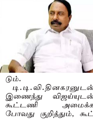
டி.டி.வி. தினகரனுடன் இணைந்து விஜய்யுடன் கூட்டணி அமைக்க போவது குறித்தும், கூட்டணி குறித்த எந்த கருத்துமே சொல்ல இயலாது. எல்லோரும் ஒருங்கிணைய வேண்டும் என்பதே ஆசை. அந்த ஆசை நிறைவேறும் காலம் வெகு விரைவில் உள்ளது. ஒருங்கிணைப்பு நடப்பெறுவது குறித்து பொறுத்திருந்து பாருங்கள். இவ்வாறு அவர் கூறினார்.

அப்போது பல்வேறு கருத்துகள் பரிமாறப்பட்டன. அதனை இங்கு பகிர்ந்து அரசியல் நாகரிகமாக இருக்காது. பா.ஜனதா தரப்பில் அழைக்கப்பட்ட பிறகுதான் டெல்லி சென்றேன் என சொன்னேன். ஒரு முறை அழைத்தார்கள். உறுது முறை நானே சந்தித்தேன். மீண்டும் அ.தி.மு.க.வில் இணைவது குறித்து தலைமை தான் முடிவு செய்ய வேண்டும்.