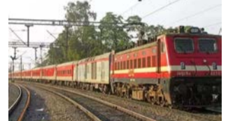
கத்தில் வண்டி எண்: 07112 கொல்லம் ஹகுர் சாஹிப் நந்தேத் சிறப்பு ரெயில் வருகிற 22ந்தேதி, 29ந்தேதி, 14சம்பர் 6, 13, 20, 27ந்தேதி கள் மற்றும் ஜனவரி 3, 10,

11ந்தேதி, 18ந்தேதி, 25ந்தேதி மற்றும் ஜனவரி மாதம் 1ந்தேதி, 8ந்தேதி, 15ந்தேதி ஆகிய (வியாழக்கிழமை) நாட்களில் ஹகுர் சாஹிப் நந்தேத் ரெயில் நிலையத்தில் இருந்து காலை 10 மணிக்கு புறப்பட்டு, சனிக்கிழமைகளில் அதிகாலை 3 மணிக்கு கொல்லத்தை சென்று அடையும். இதே ரெயில் மறுமார்ச்