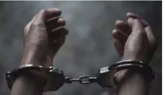
புகாரின்பேரில் மணிமங்கலம் போலீசார் வழக்குப் பதி