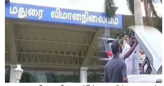
மதுரை விமான நிலையத்திற்கு 5 அடுக்கு பாதுகாப்பு போடப்பட்டு தீவிர கண்காணிப்பு டெல்லி செங்கோட்டை அருகே வாடிப்புச்சம்பவத்தைடுத்து நடவடிக்கை எடுக்க வேண்டும்.

சிக்கி விபத்து ஏற்பட்டது. இந்த விபத்தில் பின்னால் அமர்ந்திருந்த பெண் கீழே விழுந்து சம்பவ இடத்திலேயே பலியானார். விபத்து குறித்து தென்கரை போலீசார் வழக்கு பதிவு செய்து விசாரணை. தென்கரை போலீசார் வழக்கு பதிவு செய்து விசாரணை நடாடப்பெற்றது.