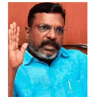
முடிச்சுப்போட்டுப் பாக் கும் நிலை உருவாகிறது. ஏற்கனவே இப்படிப்பட்ட

சுட்டப்பட்ட பகுதியிலேயே காரில் வெடிமருத்தை நிரப்பிக்கொண்டு எப்படி ஊருக்கு வழுபுத்தது? உந்துறை மற்றும் உள்வகுறை ஆகியவற்றைத் தடுத்து கட்டுப்பாட்டில் வைத்திருந்துள்ள மோடி அமிதஷா அம்பானி கூட்டணி தானே இதற்கு பொறுப்பேற்கவேண்டும்? பீகார் சட்டமன்றப் பொதுத்தேர்தலின் இரண்டாம் கட்ட வாக்குப் பதிவுக்கு முதல்நாளில் இப்படி நடந்திருப்பதால் இதனை அத்தேர்தலோடு