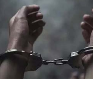
அதிரடியாக கைது செய்தனர். பின்னர் கைது செய்யப்பட்ட 12 பேரையும் போலீசார் தனி வேலை அனுமதி உள்ள வங்காளதேச அகதிகள் முகாமில் தங்க வைத்தனர்.

வேலை செய்து வந்து தெரிந்தது. அவர்கள் சட்டவிரோதமாக அந்த நாட்டில் இருந்து சேலத்திற்கு வந்து குடியரிமை பெறாமல் தங்கியது தெரியவந்தது. இதையடுத்து ஒரு பெண் உள்பட 12 பேரையும் போலீசார்