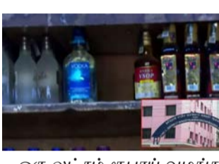
ஒரு லட்சம் ரூபாய் வழங்க உத்தரவிடக்கோரியும் நுகர்வோர் தீர்ப்பாயத்தில்

யிட்டுள்ளார். ஆனால் அவர் எந்தவொரு பதிலை இதுவாடிக்கையாளருக்கு மனைசைச்சலை ஏற்படுத்தியுள்ளது. இதனால் தன்னிடம் கூடுதலாக வசூலித்த 10 ரூபாயை திரும்பி வழங்கிட உத்தரவிடக்கோரியும், தனக்கு ஏற்பட்ட மனைசைச்சலுக்கு இழப்பீடாக