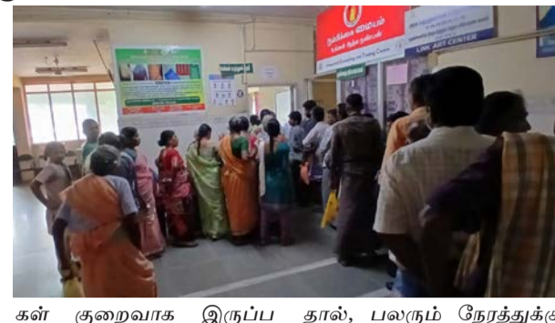
சிகிச்சை பெற முடியாமல் திரும்பி சென்ற நிலை ஏற்பட்டுள்ளது.

தேனி மாவட்டம் உத்தமபாளையம் அரசு மருத்துவமனையில் கடந்த சில நாட்களாக மருத்துவர்கள் வராததால், சிகிச்சைக்காக வரும் பொதுமக்கள் பெரும் அவதிக்குள்ளாகி வருகின்றனர்.