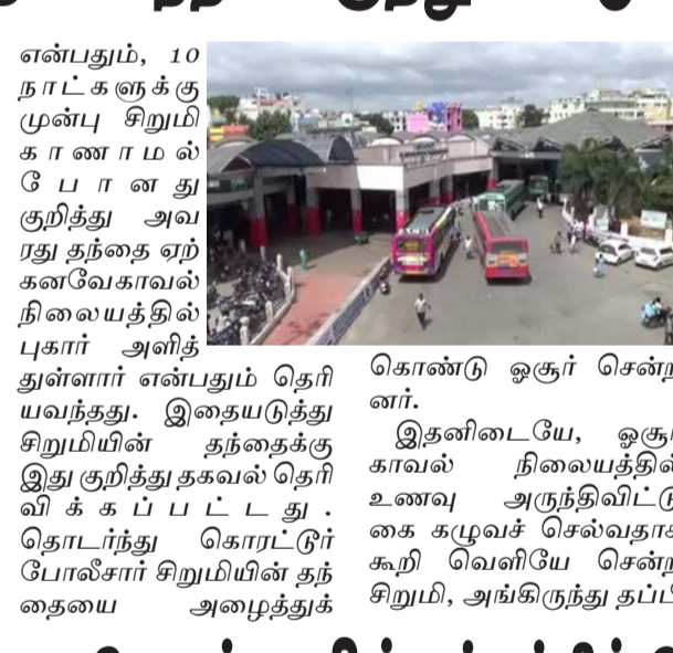
கொண்டு ஓசூர் சென்றனர்.

கிருஷ்ணகிரி, அக்.28 கிருஷ்ணகிரி மாவட்டம் ஓசூர் பேருந்து நிலையில், 16 வயது சிறுமி ஒரு வந்தனியாக சுற்றித்திரிந்த நிலையில், அப்பகுதி மக்கள் இது குறித்து போலீசாருக்கு தகவல் தெரிவித்தனர். இதையடுத்து சிறுமியை ஓசூர் அனைத்து மகளிர் காவல் நிலைய போலீசார் அழைத்துச் சென்று விசாரணை நடத்தினர்.