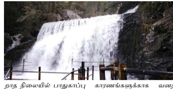
சுருளி அருவியில் பாதுகாப்பு காரணங்களுக்காக வந்த நிறையிலும் பாதுகாப்பு காரணங்களுக்காக வந்த

தேனி மாவட்டம் கம்பம் அருகே உள்ள சுருளி அருவியில் நீர்வரத்து சீராகாததால், பத்தாவது நாளாகவும் சுற்றுலா பயணிகளுக்கு விளக்க வனத்துறையினர் தடை விதித்துள்ளனர்.