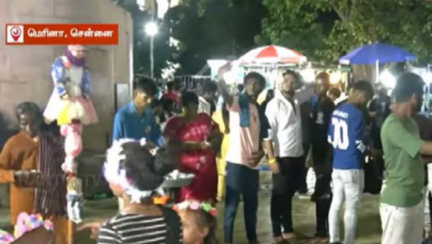
சேர்ந்த மக்கள், தீபாவளி கொண்டாட்ட தங்கச் சொந்த ஊர்களுக்கு புறப்படும் சேர்ந்தனர். இதன்படி சுமார் 18 லட்சம் பேர் சென்னையில் இருந்து புறப்பட்டுச் சென்றதாக கூறப்படுகிறது.

தங்கள் குடும்பத்தினருடன் சென்ற நேரம் செலவிட்டனர். அந்த சென்னை மெரினா கடற்கரையில் இன்று அதிக அளவிலான மக்கள் குவிந்தனர். சென்னையில் இன்று பகல் நேரத்தில் பரவலான மழை பெய்து வந்த நிலையில், மாலை நேரத்திற்கு மேல் கனமழை மக்கள் கூட்டம் குவிந்ததால் மெரினா கடற்கரை களைகட்டியது. சென்னை சேர்ந்த மக்களும், பண்டிகையை தங்கள் சொந்த ஊர்களுக்கு சென்று கொண்டாட முடியாத மக்களும் கடற்கரையில் குவிந்து மகிழ்ச்சியுடன் பொழுதை கழித்தனர்.