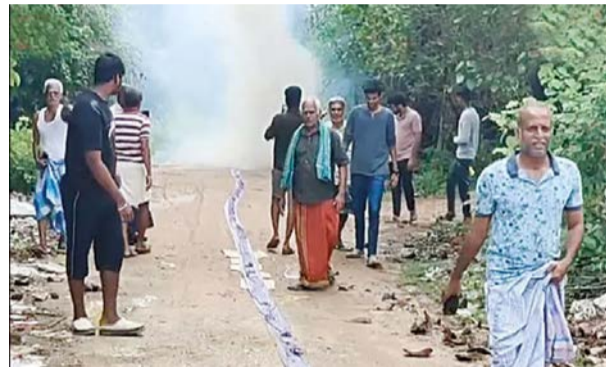
ஒன்றாக சேர்ந்து வித்தியாசமான முறையில் பட்டாசு வெடித்தனர். 10 குடும்பத்தினரும் தலா

பாலத்தின் மீது சென்ற வாகனங்கள் முகப்பு விளக்குகளை எரிய விட்டது. சென்றன. அதே சமயம் அங்கு நிலவிய இடமாத கால சூழலை அனுபவிக்க பாம்பன் பாலத்திற்கு வந்த சுற்றலா பயணிகள், ஆவலுடன் புகைப்படங்களை எடுத்துச் சென்றனர்.