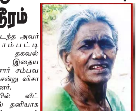
சென்றதும் தெரியவந்தது. இது குறித்து போலீசார் வழக்குப்பதிவு செய்து கொலையாளிகளை தேடி வருகின்றனர். இந்த சம்பவம் அந்த பகுதியில் பெரும் பரபரப்பை ஏற்படுத்தியுள்ளது.

உள்ளது. இந்த கோவிலுக்கு சொந்தமான பொருட்கள் மற்றும் உபகரணங்கள் அருகில் உள்ள கட்டிடத்தில் வைக்கப்பட்டிருந்தது. இந்த நிலையில் அந்தப் பகுதியை சேர்ந்த சிறுவர்கள் இன்று பட்டாசு வெடித்தபோது, எதிர்பாராதவிதமாக ஒரு பட்டாசு, அந்த கட்டிடத்திற்குள் விழுந்ததாக தெரிகிறது. இதில் அந்த கட்டிடம் முழுவதும் இடிந்து விழுந்து சேதமானது. இருப்பினும் அங்கு யாரும் இல்லாததால் பெரும் அசம்பாவிதம் தவிர்க்கப்பட்டது. மேலும் அங்கு வைக்கப்பட்டிருந்த கோவிலுக்கு சொந்தமான உபகரணங்கள் சேதமடைந்ததாக கூறப்படுகிறது. இந்த சம்பவத்தால் அந்தப் பகுதியில் சிறிது நேரம் பரபரப்பு ஏற்பட்டது.