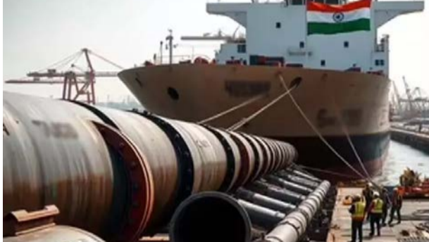
தெரிவித்து வருகிறது. அத்துடன் ரஷிய எண்ணெய் இறக்குமதிக்காக இந்தியா மீது 25 சதவீத கூடுதல் வரியையும் டிரம்ப் நிர்வாகம் விதித்தது.

புதுடெல்லி, அக்.19 உக்கரன் மீது கடந்த 2022ம் ஆண்டு பிப்ரவரியில் ரஷியா போர் தொடங்கியதில் தொடர்ந்து ஐரோப்பிய நாடுகள் ரஷியா மீது பொருளாதார தடைகளை விதித்ததுடன், அந்த நாட்டில் இருந்து கச்சா எண்ணெய் இறக்குமதியையும் ரத்து செய்தன. இதையடுத்து இந்தியாவுக்கு மலிவு விலையில் ரஷியா கச்சா எண்ணெயை வழங்கியது. இதையடுத்து இந்தியாவுக்கும் அதிக அளவில் ரஷியாவிலும் இருந்து கச்சா எண்ணெய் வாங்கி வருகிறது.