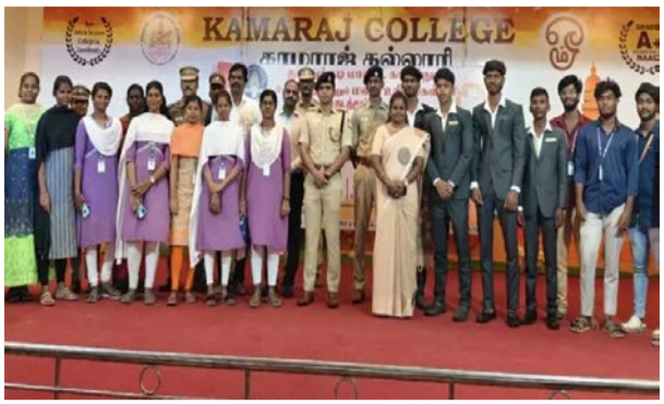
ஒற்றுமையாக இருக்க வேண்டும் என்றும், போக்சோ சட்டங்கள் குறித்தும் மற்றும் போதைப் பொருளினால் ஏற்படும் ஆபத்துகள் குறித்தும் இளைஞர்கள் போதைப் பொருளை தவிர்த்து எதிர்