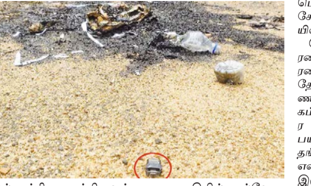
ஒரு பகுதியில் பல்வேறு காகிதங்கள் தீயில் எரிக்கப்பட்டு கிடந்தன. அதற்கு மத்தியில் ஒரு 32 ஜி.பி.

கரூர், அக்.19 கரூர் சம்பவம் தொடர்பாக சிறப்பு புலனாய்வுக் குழுவின், அங்குள்ள திட்ட அலுவலக வளாகத்தில் இருந்த கட்டிடத்தில் விசாரணை நடத்தி வந்தனர். சி.பி.ஐ. வசம் விசாரணை ஒப்படைக்கப்பட்டுள்ளதையடுத்து, அவர்கள் அந்த அலுவலகத்தை காலி செய்து சென்றனர். அங்கிருந்த நாகாலிகள், மேஜைகள் உள்ளிட்ட பொருட்கள் மீண்டும் போலீஸ் சூப்பிரண்டு அலுவலகத்துக்கு ஆயுதப்படை வாகனத்தின்