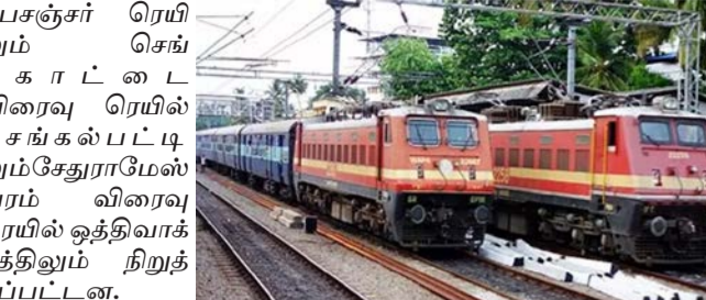
மணி நேரத்திற்கு மேலாக நிறுத்தப்பட்டன. ரெயில்வே நிலையத்தில் விழுப்புரம் மார்க்கமாக செல்லும்

சென்னை, அக்.19 செங்கல்பட்டு மாவட்டம் சென்னையில் இருந்து தென் மாவட்டங்களுக்கு செல்லும் ரெயில்கள் சிக்கலான காரணமாக சமார் ஒரு மணி நேரம் செங்கல்பட்டு ரெயில் நிலையத்திலும் மற்றும் வழியிலும் ஆங்காங்கே நிறுத்தப்பட்டன. செங்கல்பட்டு ரெயில்வே நிலையம் அருகே பரணர் என்ற இடத்தில் பாண்டிச்சேரி விசாரணை ரெயிலும் செங்கல்பட்டில் விழுப்புரம் கள் அனைத்தும் சமார் ஒரு