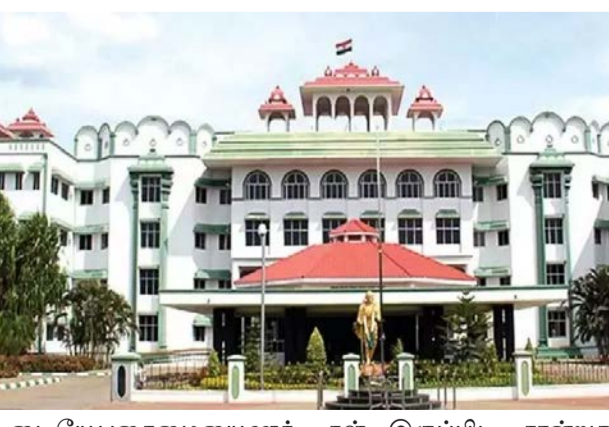
டையேபகைமையை ஊக்குவிக்கவும், பிளவுபடுத்துவதை நோக்கமாகவும் கொண்டு இந்த நடவடிக்கையை எடுத்துள்ளது. இவ்வாறு தெருக்கள், சாலைகளின் பெயர்களை மாற்றுவதால் அப்பகுதியில் வசிப்பவர்கள் இருப்பிட சான்றுகளில் முகவரியை பயன்படுத்துவதில் பல்வேறு குழப்பங்களை ஏற்படுத்தும். எனவே பெயர்களை நீக்குவதற்கு வழிவகை செய்யும் அரசாணையை ரத்து செய்யவேண்டும், என கூறியிருந்தார்.