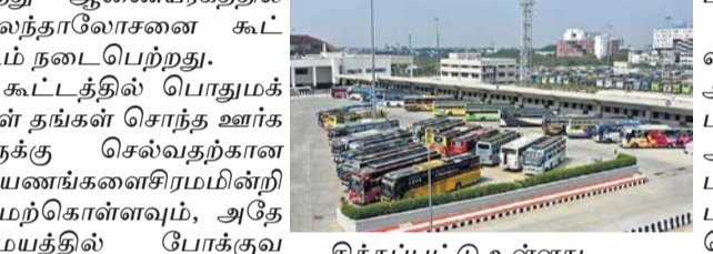
திக்கப்பட்டு உள்ளது. மேலும், பென்டிகை காலங்களில் ஆம்னி பஸ்கள் அதிக கட்டணம் வசூலிக்கக்கூடாது என அறிவுறுத்தப்பட்டு அதனை கண்காணிக்கும் பொருட்டு தமிழகம் முழுவதும் உள்ள 12 சரகங்களில் சிறப்பு பறக்கும் படை குழு அமைக்கப்பட்டு 16ந்தேதி முதல் ஆய்வு மேற்கொள்ளப்