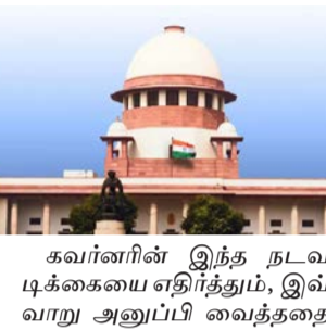
கவர்னரின் இந்த நடவடிக்கையை எதிர்த்தும், இவ்வாறு அனுப்பி வைத்ததை

ளிட்டவை கடந்த ஏப்ரல் மாதம் சட்டசபையில் நிறைவேற்றப்பட்டு, கவர்னருக்கு அனுப்பிவைக்கப்பட்டன. இவற்றுக்கு ஒப்புதல் அளிக்காமல், ஜனாதிபதிக்குத் தமிழக கவர்னர் ஆர்.என்.ரவி கட்டத் தகவல் மூலம் வாரியத்தில் அனுப்பி வைத்தார்.