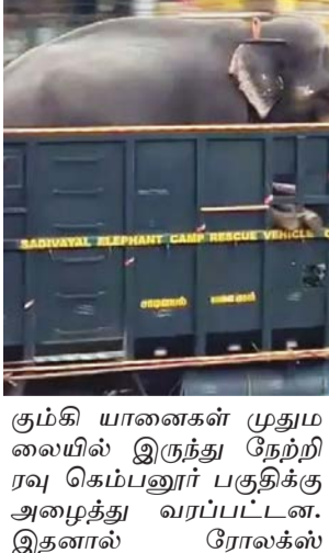
கும்கி யானைகள் முதலமைச்சர் மூலம் இரண்டு நேற்று ரவு கெம்பனூர் பகுதிக்கு அழைத்து வரப்பட்டன. இதனால் ரோலக்ஸ் யானையை பிடிப்பதற்காக

கோயம்புத்தூர் அக்.18 கோவை மாவட்டம், நரசிபுரம் கற்று வட்டாரப் பகுதிகளில் தொடர்ந்து அட்டாசாம் செய்யும் ரோலக்ஸ் என அழைக்கப்படும் ஆண் காட்டு யானையை மயக்க ஊசி செலுத்தி பிடிக்கும் பணிகளில் வனத்துறையினர் ஈடுபட்டனர். இதற்காக கும்கி யானைகள் வரவழைக்கப்பட்டன. மேலும் சின்னத்தமிழி என்ற கும்கி யானை கெம்பனூர் பகுதிக்கு வரவழைக்கப்பட்டது. இந்த குழுவில் ரோலக்ஸ் யானையை பிடிப்பதற்காக வசிடம், பொம்மன் என்ற 2