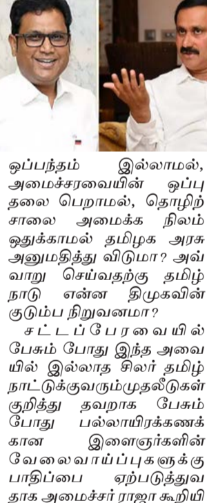
அமைச்சர் டி.ஆர்.பி. ராஜா