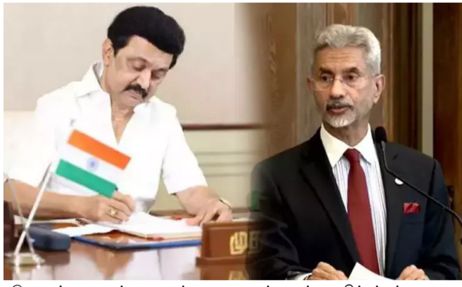
இது நான்காவது சம்பவமாகும். இந்தத் தொடர்ச்சியான கைது நடவடிக்கைகள், பாதிக்கப்பட்ட குடும்பங்களுக்கு பெருந்த மனரீதி விக்கப்பட்டுள்ளது.

சென்னை, ஜூலை 30 - இலங்கைகடற்படையால் சிறை பிடிக்கப்பட்டுள்ள தமிழக மீனவர்கள் 14 பேரை விடுவிக்க நடவடிக்கை எடுக்கக்கோரி மத்திய வெளியுறவு மந்திரி ஜெய்சங்கருக்கு மு.க.ஸ்டாலின் கடிதம் எழுதியுள்ளார். அந்த கடிதத்தில் அவர் கூறி இருப்பதாவது: "இன்று (29/07/2025) காலை இரா மநாதபுரம் மாவட்டத்தைச் சேர்ந்த ஐந்து மீனவர்கள் இயந்திரமயமாக கப்பல்தாக்க மீன்பிடிப் படகின் சிறை பிடிக்கப்பட்டிருப்பதையும், மற்றொரு சம்பவத்தில் ஒன்பது மீனவர்கள் மோட்டார் பொருத்தப்பட்ட தங்களது நாட்டுப்படகின் இலங்கைக் கடற்படைவிரால் சிறை பிடிக்கப்பட்டுள்ளனர். இந்த மாதத்தில் மட்டும்