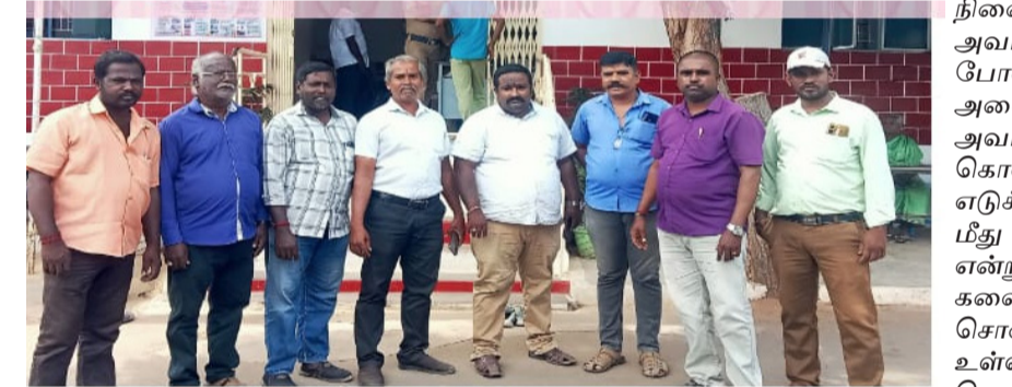
பத்திரிக்கையாளர்கள் கலந்து சென்று புகாருக்கான கொண்டு காவல் நிலையத்தில் ஆதாரங்களை காவல்

போலி பத்திரிகை சம்பந்தமாக ஆணையர் அலுவலகத்தில் சனிக்கிழமை நம்முடைய சங்க மூலமாக புகார் மனு கொடுத்துள்ளோம். அதற்காக அனுப்பப்படுகின்ற காவல் நிலையத்திலிருந்து ஏட்டையா அவர்கள் அலைபேசியில் அழைத்தார்கள். அதனால் இன்று (29/07/2025) காலை 10 மணிக்கு ஊடகக் கனி நல சங்கம் மற்றும் லட்சிய தமிழர் முன்னேற்ற சங்கம் ஆகிய இரூ சங்கத்திலிருந்தும் பொறுப்பாளர்கள் மற்றும் உறுப்பினர்கள் என பல