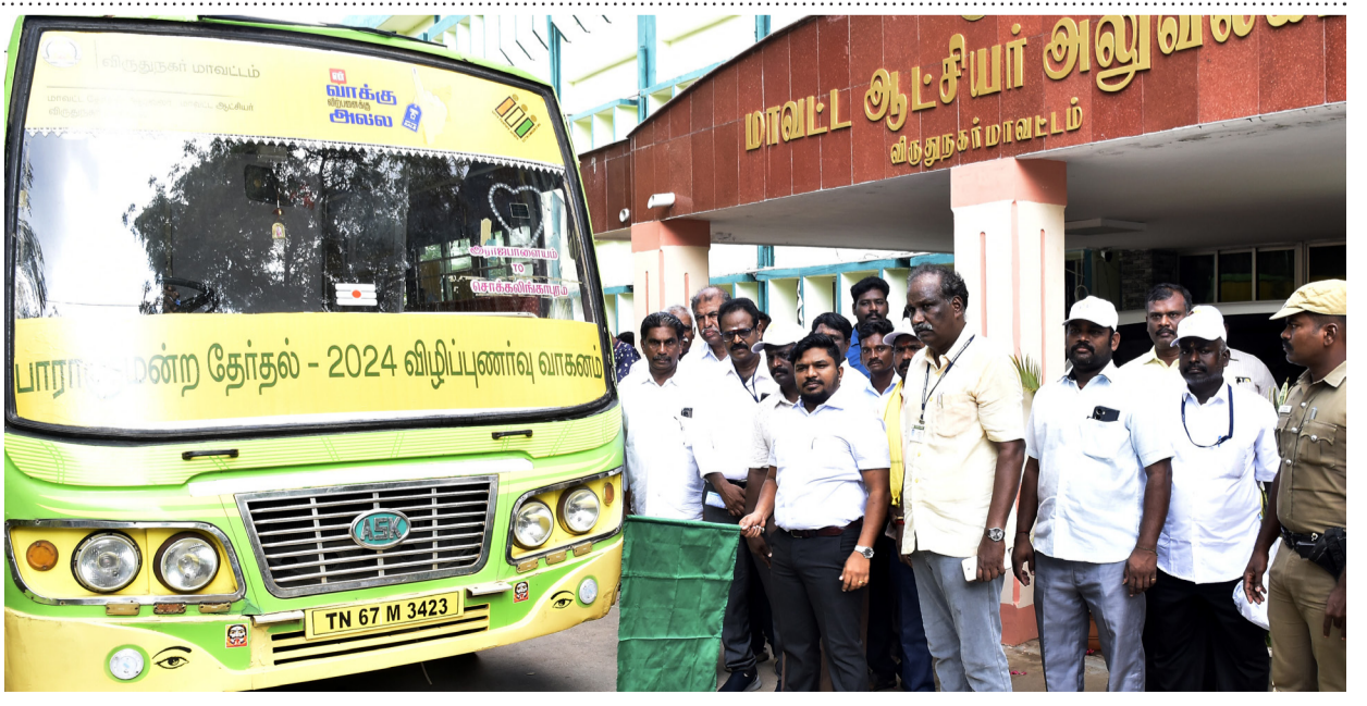
விருதுநகர் கலெக்டர் அலுவலக வளாகத்தில் மக்களவை பொதுத்தேர்தல் வாக்குப்பதிவு நடைபெறுவதை முன்னிட்டு வாக்காளர் அனைவரும் 100 சதவீதம் வாக்களிப்பதை வலியுறுத்தி தேர்தல் திருவிழா தேசத்தின் பெருவிழா என்ற தலைப்பில் இந்திய திருநாட்டின் பாராளுமன்ற தேர்தல்கள் குறித்த வரலாற்றை அனைவரும் அறிந்து கொள்ளும் வகையில் வடிவமைக்கப்பட்ட புகைப்பட கண்காட்சியுடன் கூடிய விழிப்புணர்வு வாக்களிப்பதை கலெக்டர் கொடியசைத்து தொடங்கி வைத்தார்.