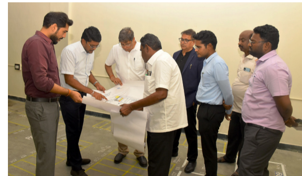
இந்த ஆய்வின் போது இராமநாதபுரம் பாராளுமன்ற தொகுதிக்கான அறந்தாங்கி, பரமக்குடி