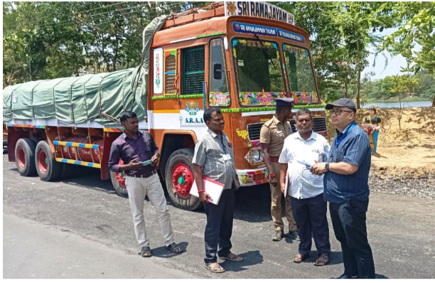
சக்கர வாகனங்களை முறையாக ஆய்வு மேற்கொள்ளுமாறு அலுவலர்களை அறிவுறுத்தினார் மேலும், ஆய்வு மேற்கொண்ட வாகனங்களின் எண்ணிக்கையை பதிவேடுகளில் பதிவு செய்யவும் சம்மந்தப்பட்ட அலுவலர்களை தேர்தல் செலவினப் பார்வையாளர் அறிவுறுத்தினார்.