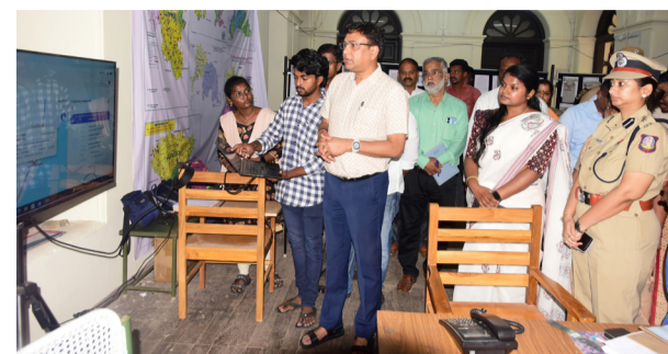
பின்னர், இந்தியத் தேர்தல் ஆணையம் உத்தரவின்படி, புதுக்கோட்டை மாவட்ட ஆட்சியரகத்தில், பாராளுமன்ற பொதுத் தேர்தல் 2024 தொடர்பாக அமைக்கப்பட்டுள்ள தேர்தல் கட்டுப்பாட்டு அறை, ஊடக மையம், ஊடக சான்றளிப்பு மற்றும் கண்காணிப்புக் குழு செயல்பாடுகளை, திருச்சி பாராளுமன்ற தொகுதி

புதுக்கோட்டை, மார்ச். 29 இந்தியத் தேர்தல் ஆணையம் உத்தரவின்படி, புதுக்கோட்டை மாவட்ட ஆட்சியரகத்தில், பாராளுமன்ற பொதுத் தேர்தல் 2024 தொடர்பாக, 24 திருச்சிராப்பள்ளி பாராளுமன்ற தொகுதிக்குட்பட்ட, 180 புதுக்கோட்டை சட்டமன்ற தொகுதி மற்றும் 178 கந்தர்வக்கோட்டை சட்டமன்ற தொகுதியில், தேர்தல் தொடர்பான முன்னேற்பாடு பணிகள் குறித்து, மாவட்ட அளவிலான ஒருங்கிணைப்பு அலுவலர் கட்டுமான ஆய்வுக் கூட்டம், திருச்சி பாராளுமன்ற தொகுதி தேர்தல் பொது பார்வையாளர் எம். தினேஷ் குமார், தலைமையில், மாவட்ட தேர்தல் அலுவலர்/ மாவட்ட கலெக்டர் ஜி. சா. மெர்சி