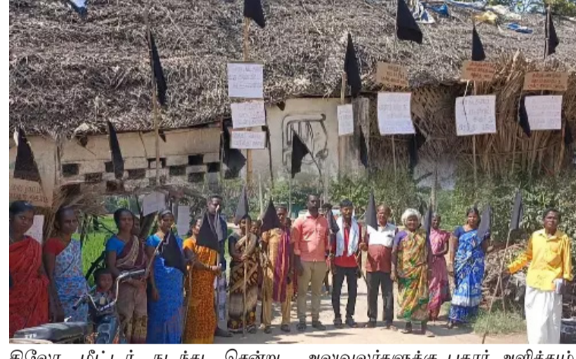
கிலோ மீட்டர் நடந்து சென்று வாக்களிக்க சிரமமாக உள்ளது எனவும் நான்கு பாலமுறைமாவட்ட ஆட்சியர், வட்டாட்சியர் உள்ளிட்ட அலுவலர்களுக்கு புகார் அளித்தும் எவ்வித நடவடிக்கை எடுக்கவில்லை எனக் கூறி தங்கள் கிராமத்திற்கு இம்முறை

திருவண்ணாமலை, மார்ச். 29 திருவண்ணாமலை மாவட்டம் போளூர் அடுத்த செங்குணம் கொள்ளை மேடு பகுதியில் சுமார் ஆயிரத்துக்கும் மேற்பட்ட குடும்பங்கள் உள்ளன. சுமார் ஐந்து தலைமுறைகளுக்கு மேல் வசித்துவரும் பழமை வாய்ந்த கிராமம் ஆகும். போளூர் அடுத்த செங்குணம் கொள்ளை மேடு கிராமத்தில் சுமார் 700 க்கும் மேற்பட்ட வாக்காளர்கள் உள்ளனர். இந்நிலையில் சுதந்திரம் அடைந்து 75 ஆண்டுகள் கடந்த நிலையிலும் சுமார் நான்கு, ஐந்து கிலோமீட்டர் கடந்து அருகில் உள்ள செங்குணம் கிராமத்திற்கு நடந்து சென்று வாக்களிக்க வேண்டிய சூழல் உள்ளதாகவும் மேலும் முதியோர்கள், கர்ப்பிணிகள், உடல்நிலை சரியில்லாமல் உள்ளவர்கள் உள்ளிட்டோர் 4,5