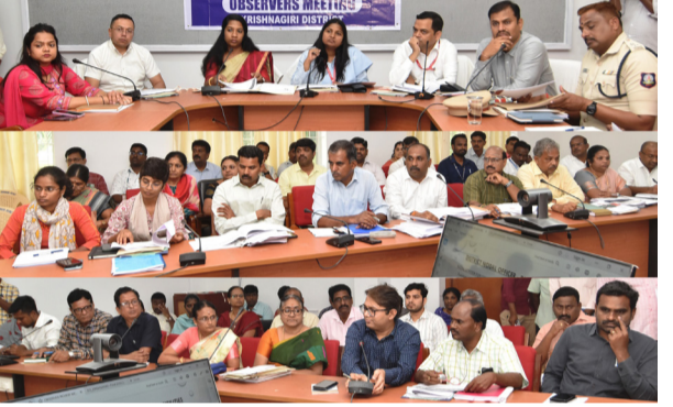
மேற்கொள்ள ஏதுவாக அனைத்து தொகுதிக்குட்பட்ட 6 சட்டமன்ற தொகுதிகளுக்கு நியமிக்கப்பட்ட குழுவினர் தேர்தல் பணிகளில் முழு பதிகைகளை முறையாக பராமரித்து அவற்றின்மீது எடுக்கப்பட்ட நடவடிக்கைகள் குறித்து முறையாக பதிவு செய்ய வேண்டும். எனவே, தேர்தல் சிறப்பான முறையில் நடைபெற அனைவரும் முழு ஒத்து