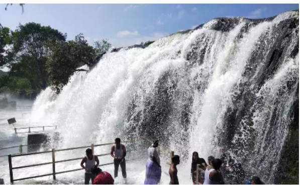
கோதையாற்றில் ஏற்பட்ட வெள்ளப்பெருக்கு சுற்று குறைந்ததால் திறக்கப்பட்டது. அருவியில் மிதமான அளவு தண்ணீர் கொட்டி வருகிறது. அருவியில் குளிப்பதற்கு 4 நாட்கள் தடை விதிக்கப்பட்டுள்ள நிலையில் இன்று குளிப்பதற்கான தடை நீக்கப்பட்டுள்ளது. இன்று காலை சுற்றுலா பயணிகள் குளிக்க அனுமதிக்கப்பட்டனர். அருவியில் குளிப்பதற்கு சுற்றுலா பயணிகள் மற்றும் அய்யப்ப பக்தர்களின் கூட்டம் அலைமோதியது. அவர்கள் அருவியில் ஆனந்த குளியலிட்டு மகிழ்ந்தனர்.

நாகர்கோவில், டிச.22 குமரி மாவட்டத்தில் கொட்டி தீர்த்த மழையின் காரணமாக பேச்சிப்பாறை, பெருஞ்சாணி, சிற்றாறு, மாம்பழத்துறை யாறு, முக்கடல் அணைகள் முழு கொள்ளளவு எட்டி நிரம்பி வழிகின்றன. தொடர்ந்து அணைகளுக்கு நீர்வரத்து அதிகரித்ததையடுத்து பேச்சிப்பாறை, பெருஞ்சாணி, சிற்றாறு அணைகளில் இருந்து உபரிநீர் திறக்கப்பட்டது. இதனால் கோதை ஆறு, குழித்துறை தாமிரபரணி ஆறுகளில் வெள்ளம் கரைபுரண்டு ஓடியது. கடந்த 2 நாட்களாக மழை குறைந்ததையடுத்து அணைகளுக்கு வரக்கூடிய நீர்வரத்து படிப்படியாக குறைந்து வருகிறது.