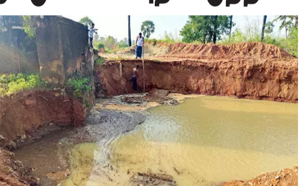
கிணற்றை நேரில் சென்று ஆய்வு செய்தனர். மேலும் சென்னை ஐ.டி.டி. புவியியல் துறை பேராசிரியர் வெங்கடராமன் மணசீனிவாசன் தலைமையிலான குழுவினர் நேரில் பார்வையிட்டு 4 மறை ஆய்வு செய்தனர். அதிசய கிணறு, தண்ணீரின் தன்மை, அருகில் உள்ள மற்ற கிணறுகளின் தன்மை மற்றும் நிலத்தடி நீர்மட்டம், ராதாயுர் முதல் சாத்தன்குளம் வரை 150 கி.மீ. தூரத்தில் உள்ள நீர் ஆய்வு செய்யப்பட்டது. அதன் பயனாக பூமிக்கு அடியில் கண்ணாம்பு பாறைகள்

திசையன்விளை, டிச.22 நெல்லை மாவட்டம் திசையன்விளை அருகே உள்ள ஆயன்குளம் படுகை அருகே 2 மட்பு செட் கிணறு உள்ளது. சுமார் 75 அடி ஆழம் கொண்ட பழமையான இந்த கிணற்றில் மழைக் காலங்களில் படுகைகளில் உள்ள தண்ணீரை அந்த பகுதி விவசாயிகள் கால்வாய் வெட்டி கிணறு களுக்குள் விட்டனர்.