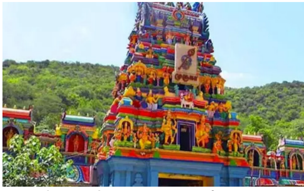
பஞ்சாமிர்த விற்பனை தொடங்கப்பட்டது. அதன் தொடர்ச்சியாக 5 மாதங்களில் ரூ.13 லட்சத்திற்கு பஞ்சாமிர்தம் விற்பனை ஆனது. இந்த

மதுரை, டி.ச.14 முருகப்பெருமானின் அறுபடை வீடுகளில் 6 வது படை வீடாக சிறப்பு பெற்றது பழமுதர் சோலைமுருகன் கோவில். பிரசித்தி பெற்ற அழகர் மலையில் உள்ளதால் இங்கு பக்தர்களின் வருகை எப்போதும் அதிகமாக இருக்கும்.