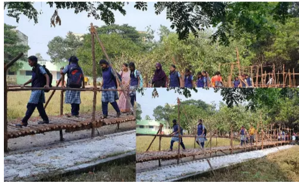
முதல் அரையாண்டு தேர்வு தொடங்கி உள்ளதால் அரசு ஆண்கள் மற்றும் பெண்கள் மேல்நிலைப்பள்ளிகளை இன்று திறக்க வளாகத்தில் உள்ள தண்ணீரை வெளியேற்றும் பணி வேகமாக நடைபெற்றது. எனினும் பெண்கள் மேல்நிலைப்பள்ளியில் மழைநீரை இன்னும் முழு

பூத்தமல்லி, டி.ச.14 மிச்சாப்பயல் காரணமாக கொட்டி தீர்த்த கனமழையால் பூத்தமல்லி நகராட்சிக்கு உட்பட்ட பல்வேறு பகுதியில் மழைநீர் தேங்கியது. தற்போது மழை வெள்ளம் வடிந்து இயல்பு நிலை திரும்பி உள்ளது. எனினும் நிலையில் பூத்தமல்லியில் உள்ள அரசு ஆண்கள் மற்றும் பெண்கள் மேல்நிலைப்பள்ளி வளாகத்தில் மழைநீர் செல்ல வழியில்லாததால் தொடர்ந்து தேங்கி நின்று வருகிறது. இதனால் மழைவெள்ள விடுமுறைக்கு பின்னர் மற்ற பள்ளிகள் திறக்கப்பட்டாலும் இந்த பள்ளிகளுக்கு நேற்று விரைவிடுமுறை அளிக்கப்பட்டது. இந்த நிலையில் இன்று