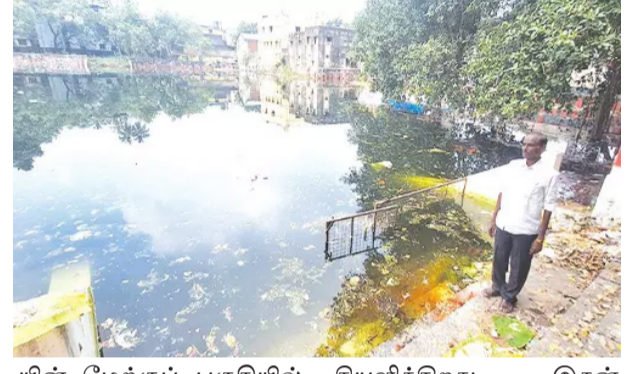
யம் பெய்த பலத்த மழையால் 30 அடிக்கு மேல் மழைநீர் தேங்கி உள்ளது. இதனை பார்க்கும் போது மகிழ்ச்சியாக உள்ளது. மேலும் குளத்தில் மழைநீர் தேங்கும் வகையில் கிழக்குப் பகுதியில் இருந்து 250 மீட்டர் அளவிற்கு மழைநீர் வடிகால் அமைத்து கிழக்குப் பகுதியில் தேங்கும் மழைநீரை குளத்திற்குள் விடும் பணிகள் விரைவில் தொடங்கும். காசி விஸ்வநாதர் கோவில் நிர்வாகத்தின்கீழ் வரும் இந்த குளத்தினை நாங்கள் சரி செய்து விட்டோம். ஆனால் கோவில் நிர்வாகத்தினர் கோவில் குளத்தினை முறையாக பராமரிக்காத காரணத்தினால் சுற்றி உள்ள அரத்தில் உள்ள கழிவுகள் அனைத்தும் குளத்தில் மிதக்கிறது. இதனை சரி செய்ய எங்கள் பங்களிப்பை நாங்கள் தருவதற்கு தயாராக இருக்கிறோம். கோவில் நிர்வாகத்திடம் கோவில் குளத்தை முறையாக பராமரிக்க வேண்டும் என்பது எனது தாழ்வுரை அளித்துள்ளேன்.