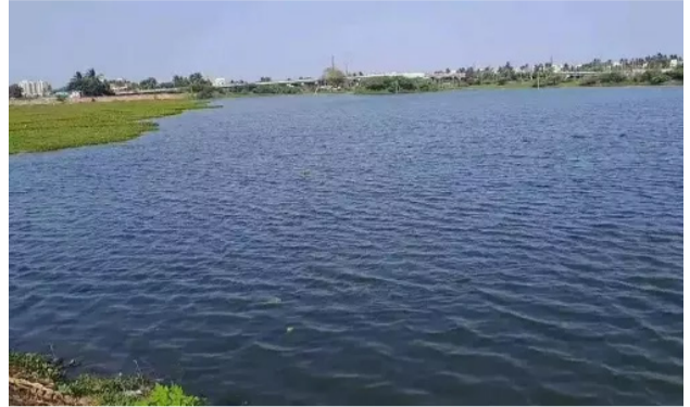
நிலையில் உள்ளன. செங்கல்பட்டு மாவட்டத்தில்

செங்கல்பட்டு, டி.ச.14 வாடகிழக்கு பருவமழை தொடங்கியது முதலே சென்னை, செங்கல்பட்டு, திருவள்ளூர், காஞ்சிபுரம் மாவட்டங்களில் உள்ள ஏரிகளுக்கு நீர்வரத்து காணப்பட்டது. மிச்சாப்பயல் மற்றும் கனமழை காரணமாக 4 மாவட்ட ஏரிகளுக்கும் நீர்வரத்து அதிகரித்தது. இதனால் சென்னையில் 26 ஏரிகள் முழுமையாக நீரம்பின. மீதமுள்ள 2 ஏரிகள் நீரம்பின 462 ஏரிகள் முழு கொள்ளை எட்டி உள்ளன. 68 ஏரிகள் நீரம்பின நிலையில் உள்ளன. திருவள்ளூர் மாவட்டத்தில் 442 ஏரிகள் முழுமையாக நீரம்பி விட்டன. 59 ஏரிகள் நீரம்பின நிலையில் உள்ளன. காஞ்சிபுரம் மாவட்டத்தில் 205 ஏரிகள் நீரம்பி உள்ளன. 104 ஏரிகள் நீரம்பின நிலையில் உள்ளன. 4 மாவட்டங்களிலும் மொத்தம் 1135 ஏரிகள் முழு கொள்ளை எட்டியுள்ளன.