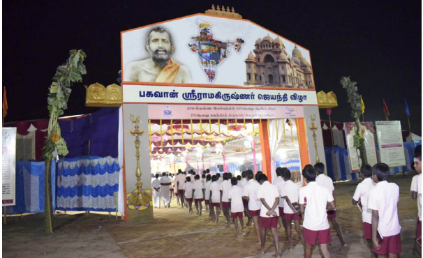
தொடர்ந்து 8 மணி அளவில் வித்யாலயா கலை அறிவியல் கல்லூரியின் சுயநிதி பிரிவு வளாகத்தில் அமைக்கப்பட்டுள்ள கலை மற்றும் கல்விப் பரமஹம்சர் குருபூஜை விழா வரும் குடியிறுக்கிழமை ஜனவரி 07ஆம் தேதி நடக்கிறது. இதில் முதல் நிகழ்ச்சியாக அதிகாலை 5 மணி முதல் ஆரத்தி, பூஜை மற்றும் பெரியநாயக்கன்பாளையம் பஜனைக்குழு, பாலமலை அரங்கநாதர் பஜனை குழு, அவினாசிவிங்கம் மனையியல் பல்கலைக்கழக மாணவிகளின் பஜனை, தண்ட பாணி நாம சங்கீர்த்தனை குழு வினிகள் பஜனை, மேட்டுப்பாளையம் ஸ்ரீ முத்துமலை விழா பந்தலில் நடக்கும் பொருட்காட்சி துவக்க விழாவில் சுவாமி விமோக்யானந்தர், நீதிபதி ஜி.ஆர்.சுவாமிநாதன் ஆகியோர் சொற்பொழிவு வாழ்த்துகளையும் அளித்துள்ளனர். அந்த நிகழ்ச்சியை பொட்டி வெற்றி

மேட்டுப்பாளையம், ஜன.6 கோவை, பெரியநாயக்கன்பாளையத்தில் உள்ள ஸ்ரீ ராமகிருஷ்ண மிஷன் வித்யாலயத்தில் பகவான் ஸ்ரீ ராமகிருஷ்ண பரமஹம்சர் குருபூஜை விழா வரும் குடியிறுக்கிழமை ஜனவரி 07ஆம் தேதி நடக்கிறது. இதில் முதல் நிகழ்ச்சியாக அதிகாலை 5 மணி முதல் ஆரத்தி, பூஜை மற்றும் பெரியநாயக்கன்பாளையம் பஜனைக்குழு, பாலமலை அரங்கநாதர் பஜனை குழு, அவினாசிவிங்கம் மனையியல் பல்கலைக்கழக மாணவிகளின் பஜனை, தண்ட பாணி நாம சங்கீர்த்தனை குழு வினிகள் பஜனை, மேட்டுப்பாளையம் ஸ்ரீ முத்துமலை விழா பந்தலில் நடக்கும் பொருட்காட்சி துவக்க விழாவில் சுவாமி விமோக்யானந்தர், நீதிபதி ஜி.ஆர்.சுவாமிநாதன் முதன்மை விழா பந்தலில் பார்வையடுகிறார். பின்னர் நாதன் குத்து விளக்கு ஏற்றி திறந்து வைத்து பார்வையடுகிறார். பின்னர் முத்துமலை விழா பந்தலில் நடக்கும் பொருட்காட்சி துவக்க விழாவில் சுவாமி விமோக்யானந்தர், நீதிபதி ஜி.ஆர்.சுவாமிநாதன் ஆகியோர் சொற்பொழிவு வாழ்த்துகளையும் அளித்துள்ளனர். அந்த நிகழ்ச்சியை பொட்டி வெற்றி