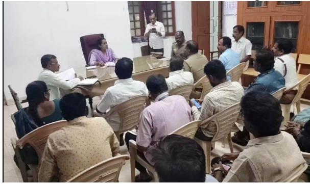
மற்றும் தேர்த்திருவிழா கடந்த டிசம்பர் 28 ம் தேதி பூச்சாட்டுதலுடன் தொடங்கியது. அதைத் தொடர்ந்து திருவிழாவின் முக்கிய நிகழ்ச்சிகளாக 8 ம் தேதி சந்தனகாப்பு அவல்காரமும், 10 ம் தேதி இரவு குண்டம் திறப்பு நிகழ்ச்சியும், 11 ம் தேதி அதிகாலை திருவிழாவின் முக்கிய நிகழ்வான

கோபி, ஜன.6 கோபிசெட்டி பாளையத்தில் புகழ்பெற்ற பாரியூர் கொண்டத்து காளியம்மன் கோயில் குண்டம் மற்றும் தேர்த்திருவிழா விற்கு அதிகளவில் பக்தர்கள் குண்டம் இறங்கி நேர்த்திகடன் செலுத்துவார்கள் என்பதால் பாதுகாப்பு ஏற்பாடுகள் குறித்து அதிகாரிகளுடன் கோட்டாட்சியர் தீவிர பிரயத்தனங்களில் ஆலோசனை செய்தார். கோபிசெட்டி பாளையத்தில் புகழ்பெற்ற பாரியூர் கொண்டத்து காளியம்மன் கோயிலானது பல நூறு ஆண்டுகள் பழமையான கோயிலாகும். இந்த கோயிலில் ஆண்டுதோறும் ஜனவரி மாதம் குண்டம் மற்றும் தேர்த்திருவிழா நடைபெறுவது வழக்கம். இந்த ஆண்டு குண்டம்