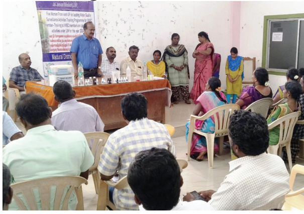
இதில் துணை வட்டார வளர்ச்சி அலுவலர்கள் உள்ளிட்ட பலர் கலந்து முத்துபாண்டி, அரக அலுவலர்கள் உள்ளிட்ட பலர் கலந்து கொண்டனர்.

18 பஞ்சாயத்தில் உள்ள ஊராட்சி மன்ற தலைவர்கள், ஊராட்சி செயலாளர்கள் மற்றும் மகளிர்சுயஉதவி குழு பெண்களுக்கு இந்த பயிற்சி வழங்கப்பட்டது. இதில் கிராமத்தில் வரும் குடிநீரில் கிரிமிநாசினிகள், தரமான முறையில் குடிநீர் வருவது, குடிநீர் சோதனை பெறுவது, குடிநீரில் குளோரின் அளவு உள்ளிட்டவைகள் கண்டறிவது குறித்து பயிற்சி வழங்கப்பட்டது.