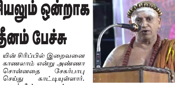
யதற்கு என்னை தி.மு.க.காரன் என்று முத்திரை குத்துகின்றனர். எல்லா கட்சிகளுக்கும் பொதுவானவன் நான். நல்ல காரியம் யார் செய்தாலும் பாராட்டுவேன். துணை முதல் அமைச்சர் உதயநிதி ல்லாவின் மறைவு வெள்ளத்தின்போது சிறப்பாக பணியாற்றினார். இவ்வாறு அவர் கூறினார்.