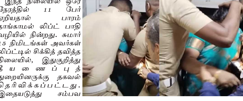
இந்த நிலையில் ஒரு நேரத்தில் 11 பேர் ஏறியதால் தாங்களால் லிப்ட் பாதிவழியில் நின்றது. சுமார் 15 நிமிடங்கள் அவர்கள் லிப்ட்டில் சிக்கித் தவித்த நிலையில், இது குறித்து தீயணைப்புத் துறையினருக்கு தகவல் தெரிவிக்கப்பட்டது. இதையடுத்து சம்பவ

சென்னை, டிச. 8 சென்னை மாதவரம் அருள்நகர் பகுதியில் உள்ள தனியார் திருமண மண்டபத்தில் திருமணநிச்சயதார்த்த நிகழ்ச்சி நடைபெற்றது. இந்த நிகழ்ச்சியில் கலந்துகொள்வதற்காக வந்த 7 பெண்கள், 4 ஆண்கள் ஆகிய 11 பேர் மண்டபத்தின் மேல்தளத்திற்கு செல்வதற்காக அங்கு லிப்ட்டை