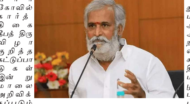
அறநிலையத்துறை செயலாளர் மற்றும் முக்கிய அதிகாரிகளுடன் ஆலோசனை நடைபெற உள்ளது. இந்த ஆலோசனை கூட்டத்தில் திருவண்ணாமலை தீபத் திருவிழாவுக்கு கட்டுப்பாடுகள் விதிப்பது குறித்து முடிவெடுக்கப்படும். மேலும் மலை உச்சிக்கு செல்ல எவ்வளவு பேரை அனுமதிப்பது என்பது குறித்தும் முடிவெடுக்கப்படும். 3 இடங்

சென்னை, டிச. 8 திருவண்ணாமலை அண்ணாமலையார் கோவில் கார்த்திகை தீபத் திருவிழா தொடங்கி நடைபெற்று வருகிறது. விழாவின் முக்கிய உற்சவங்களில் ஒன்றான மகா தேரோட்டம் 10ந்தேதி நடைபெற உள்ளது. 13ந்தேதி அதிகாலை கோவிலில் பரணி தீபமும், மாலை 2,668 அடி உயர் மலை உச்சியில் மகா தீபமும் ஏற்றப்பட உள்ளது. மகா தீப தரிசனத்தை 11 நாட்களுக்கு பக்தர்கள் காணலாம். கார்த்திகை தீபத்தி் திருவிழா சண்டிகேஸ்வரர் உற்சவத்துடன் 17ம் தேதி நிறைவு பெறுகிறது. இந்த நிலையில் திருவண்ணாமலை அண்ணாமலை