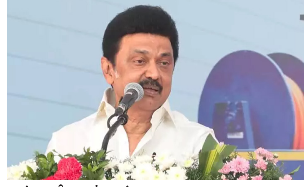
மைப் பணியாளர்களுக்கு சுகாதார அட்டைகளையும், 30 நரிக்குறவர்களுக்கு தமிழ்நாடு நகர்ப்புற வாழ்விட மேம்பாட்டு வாரிய திட்டப் பகுதியில் வீடுகள் கட்டுவதற்கான

சென்னை, டிச. 8 சென்னை, எழும்பூர் ராஜரத்தினம் மைதானத்தில் நடைபெற்ற அரசு விழாவில், நகராட்சி நிர்வாகம் மற்றும் குடிநீர் வழங்கல் துறையின் சார்பில் தூய்மைப் பணியாளர்களை தொழில் முனைவோர்களாக மாற்றும் திட்டத்தின் கீழ் தூய்மைப் பணியாளர்களுக்கு 213 நவீன கழிவுநீர் அகற்சிகள் வாங்குவதற்காக 100 நவீன கழிவுநீர் அகற்சிகள் வாங்குவதற்காக முதல் அமைச்சர் மு.க.ஸ்டாலின் வழங்கினார். மேலும், அம்பேத்கர் தொழில் முன்னோடிகள் திட்டத்தின் கீழ் 128 பயனாளிகளுக்கு கடனுதவிக் கான ஆணைகளையும், 100 தூய்