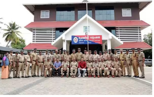
முந்தைய ஆண்டுகளில், மலப்புரம் மாவட்டத்தில் உள்ள குற்றப்பிரம், கண்ணூர் நகரில் உள்ள வடபுலம் ஆகிய போலீஸ் ஸ்டேஷன்கள், நாட்டின் சிறந்த 10 போலீஸ் ஸ்டேஷன்களில் பட்டியலில் இடம்

விசாரணை, சட்ட அமலாக்கம், அடிப்படை வசதிகள், அணுகு முறை, லாக்கப் மற்றும் பதிவு அறை உள்ளிட்ட வசதிகள் என, நெறிமுறைகளை அடிப்படையாகக் கொண்டு மத்திய உள்துறை அமைச்சகம் சிறந்த போலீஸ் ஸ்டேஷனை தேர்ந்தெடுத்து உள்ளது. பெண்கள் மற்றும் குழந்தைகளுக்கு எதிரான வன்முறைகள் மீது எடுத்த நடவடிக்கை, வழக்கு விசாரணையின் வளர்ச்சி, புகார் தீர்வு, புகார்தாரர்களிடம் உள்ள அணுகுமுறை, குற்ற செயல்கள் தடுப்பதற்கான நடவடிக்கைகள் ஆகியவையில் உள்ள சிறப்பு மற்றும் பிற பொது நலச் செயல்பாடுகள் போன்றவற்றின் அடிப்படையில் தேர்வு செய்யப்பட்டுள்ளது. இவ்வாறு, அவர் கூறினார்.