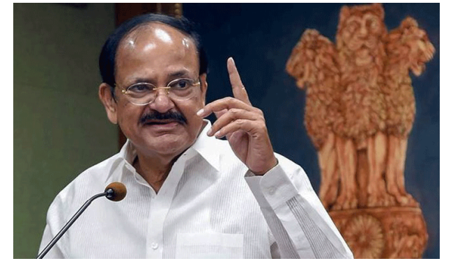
மேலும் சூரிய உதயத்தின்போதே எழுந்திருக்க வேண்டும் என்று பேசிய வெங்கையா நாயுடு, தான் குறிப்பிட்டது வானத்தில் உதிக்கும் சூரியன்(Sun) என்றும், இங்குள்ள உள் ளர் கட்சி தலைவரின் மகன்(Son) அல்ல என்றும் மறைமுகமாக அரசியல் நகைச்சுவை கலந்து பேசினார்.

நாயுடு, இந்தியாவில் 2 சதவீதமக்களே ஆங்கிலத்தை புரிந்து கொள்வதாகவும், அனைவரும் இந்தி உள் பட மற்ற மொழிகளை படிக்க வேண்டும் என்றும் கூறினார். இந்தி எதிர்ப்பு போராட்டத்தில் தாலும் கலந்து கொண்டதாக குறிப்பிட்ட அவர், இந்தி எழுத்தின் மீது கருப்பு மை பூசி அழித்ததை, தன்னுடைய முகத்திலேயே பூசியது போல் கருதுவதாக தெரிவித்தார்.