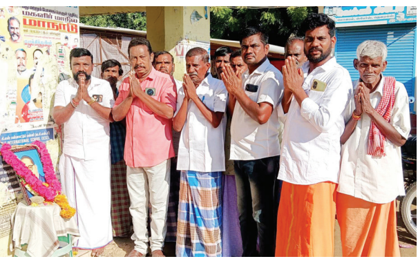
மரியாதை செலுத்தப்பட்டது. இதனையடுத்து ஏழை எளிய மக்களுக்கு அன்னதானமாக