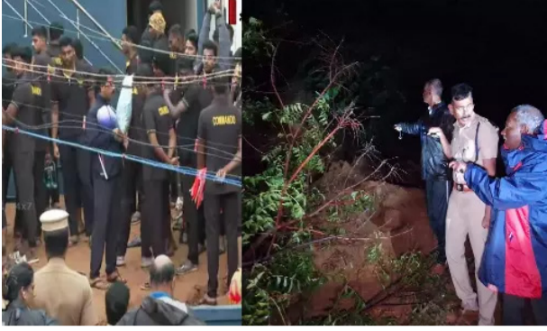
திருவண்ணாமலை அருணாச்சலேஸ் வரர் கோவில் பின்புறம் உள்ள மலையிலிருந்து சரிந்த பாறைகள் வீடுகள் மீது விழுந்தன. பாறைகளுடன் மண்ணும் சரிந்ததால்

திருவண்ணாமலை, டி.ச.3 அருணாச்சலேஸ் வரர் கோவில் பின்புறம் உள்ள மலையிலிருந்து சரிந்த பாறைகள் வீடுகள் மீது விழுந்தது. பாறையுடன் மண்ணும் சரிந்து வீடுகளை மூழ்கடித்தன. ஃபெஞ்சல் புயல் காரணமாக விழுப்புரம், கடலூர், கள்ளக்குறிச்சி, திருவண்ணாமலை மாவட்டங்களில் கனமழை வெளுத்து வாங்கியது. புயல்கரையை கடந்த நிலையிலும் தொடர் கனமழையால் விழுப்புரம், கடலூர், கள்ளக்குறிச்சி, திருவண்ணாமலை அருணாச்சலேஸ் வரர் கோவில் பின்புறம் உள்ள மலையிலிருந்து சரிந்த பாறைகள் வீடுகள் மீது விழுந்தன. பாறைகளுடன் மண்ணும் சரிந்ததால்