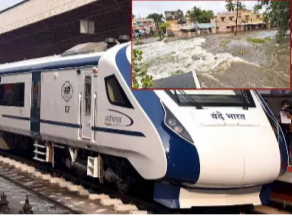
தேபாரத், மதுரை சென்னை மற்றும் கார்க்குடி எழும்பூர் ரெயில்களும் ரத்து செய்யப்பட்டுள்ளது. இந்த தகவலை தெற்கு ரெயில்வே வெளியிட்டுள்ளது.

கடந்த பின்னரும் கனமழை பெய்ததால் எங்கு பார்த்தாலும் வெள்ளக்காடாக காட்சி அளிக்கிறது. விக்கிரவாண்டி முண்டியபாக்கம் ரெயில் நிலையங்களுக்கு இடையே உள்ள பாலத்தில் அபாய அளவை தாண்டி நீர் செல்வதால் ரெயில் சேவை ரத்து செய்யப்பட்டுள்ளது. இந்த நிலையில் சென்னை யில் இருந்து செல்லும் பகல் நேர ரெயில்கள் ரத்து செய்யப்பட்டுள்ளது. சென்னை நாகர்கோவில் வந்தே பாரத் ரெயில், சென்னை மதுரை தேஜஸ் எக்ஸ்பிரஸ் ரெயில்கள் ரத்து செய்யப்பட்டுள்ளது. அத்தேபோல் நெல்லை சென்னை வந்தே பாரத், மதுரை சென்னை மற்றும் கார்க்குடி எழும்பூர் ரெயில்களும் ரத்து செய்யப்பட்டுள்ளது. இந்த தகவலை தெற்கு ரெயில்வே வெளியிட்டுள்ளது.