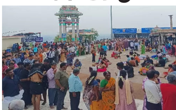
மாநிலங்களில் இருந்து ஐயப்பன் கோவிலுக்கு செல்லும் பக்தர்கள் ஆன்மீக பயணமாக பழனி, ராமேஸ்வரம் உள்ளிட்ட புண்ணிய ஸ்தலங்களுக்கும் செல்கின்றனர். இன்று விடுமுறை தினம் என்பதால் ஐயப்ப பக்தர்கள் மட்டுமின்றி சுற்று வட்டாரப் பகுதிகளில் இருந்தும் ஏராளமானோர் வந்திருந்ததால் கூட்டம் அதிகரித்து காணப்பட்டது. ரோப்பார் நிலையம், மின் இழுவை நிலையம், அடிவாரம், கிரிவீதி, படிப்பாறை, யாண்ப்பாறை உள்ளிட்ட இடங்களில் அதிக அளவு பக்தர்கள் வந்திருந்தனர். மலைக்கோவிலில் நீண்ட

பழனி, டி.ச.3 தமிழ் கடவுள் முருகப்பெருமானின் 3ம் படை வீடான பழனிக்கு தமழகம் மட்டுமின்றி வெளி மாநிலங்கள், வெளிநாடுகளில் இருந்து ஏராளமான பக்தர்கள் வருகின்றனர். வருடம் முழுவதும் திருவிழாக்கோலம் பூண்டிருக்கும் பழனியில் ஏராளமான பக்தர்கள் குவிந்து வருகின்றனர். குறிப்பாக விடுமுறை நாட்களில் சுற்று வட்டாரப் பகுதிகளில் இருந்தும், வெளி மாவட்டங்களில் இருந்தும், கோலாவில் இருந்தும் பக்தர்கள் வருகின்றனர். சபரிமலை சீசன் தொடங்கி உள்ள நிலையில் ஆந்திரா, தெலுங்கானா, கர்நாடகா உள்ளிட்ட