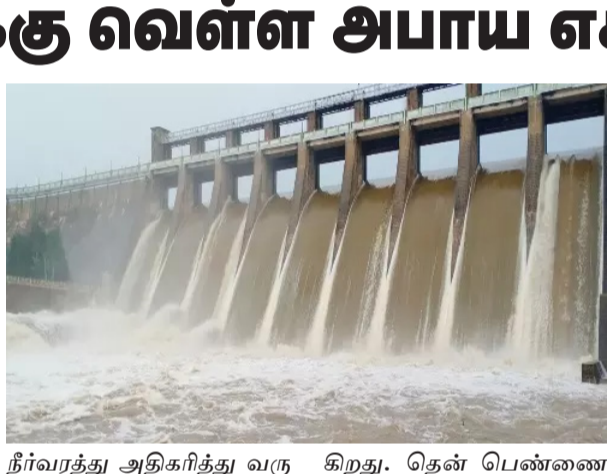
நீர்வரத்து அதிகரித்து வருகிறது. தென் பெண்ணை ஆற்றின் குறுக்கே கட்டப்பட்டுள்ள, சாத்தனூர் அணையில் நீர்வரத்து அதிகரிப்பால், மொத்த உயரமான 119 அடியில் முழுவதும் நிரம்பியது. இதனால் அணையில் இருந்து சுமார் 1.68 லட்சம் கன அடி தண்ணீர் வெளியேற்றப்படுவதால், தென்பெண்ணை ஆற்றங்கரையோர மக்களுக்கு வெள்ள அபாய எச்சரிக்கை அளிக்கப்பட்டுள்ளது.

திருவண்ணாமலை, டி.ச.3 கடந்த இரண்டு நாட்களாக நீர்வரத்து அதிகரித்து வருகிறது. அணையில் நீர்வரத்து அதிகரிப்பால், மொத்த உயரமான 119 அடியில் முழுவதும் நிரம்பியது.