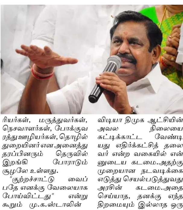
ரியர்கள், மருத்துவர்கள், நெசவாளர்கள், போக்குவரத்து ஊழியர்கள், வேண்டியது எதிர்க்கட்சித் தலைவர் என்ற வகையில் என்னுடைய கடமை. அதற்கு முறையான நடவடிக்கை எடுத்து செயல்படுத்துவது அரசின் கடமை. அதை செய்யாத, தனக்கு எந்த திறமையும் இல்லாத ஒரு

சென்னை, டி.ச.3 போதைப்பொருள் பழக்கம் தலைவிரித்து ஆடுகிறது. விடியா திமுக ஆட்சியின் அவல நிலையை சுட்டிக்காட்ட வேண்டியது எதிர்க்கட்சித் தலைவர் என்ற வகையில் என்னுடைய கடமை. அதிமுக பொதுச் செயலாளரும் எதிர்க்கட்சித் தலைவருமான எடப்பாடி பழனிசாமி வெளியிட்டிருந்த எக்ஸ் தள பதிவில், தமிழ்நாட்டில் பல்வேறு இடங்களில் கொலை, கொள்ளை போன்ற சட்டம் ஒழுங்கு சீர்கேடுகளால் மக்களுக்கு பழகாப்பு இல்லாதது கமல் நிலவுகிறது. போதைப்பொருள் பழக்கம் தலைவிரித்து ஆடுகிறது. இதுமட்டுமன்றி ஆசி