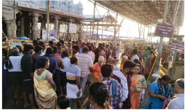
நடை அதிகாலை 4 மணிக்கு திறக்கப்பட்டது. 4.30 மணிக்கு வில்வரூபம், 6 மணிக்கு உதய மார்த்தாண்ட அபிஷேகம், தொடர்ந்து மற்ற கால பூஜைகள் நடக்கிறது. இதற்கிடையே அமாவாசையையொட்டி நேற்று முன்தினம் முதலே கடல் உள்வாங்கி காணப்பட்டது. நேற்று உதய நாளாக கமர் 80 அடி வரை கடல் உள்வாங்கி இருந்தது. இந்நிலையில் 3வது நாளாக இன்றும் கடல் உள்வாங்கி காணப்பட்டது. இதனால் கடற்பாடிகள் வெளியே தெரிந்தது.

ணக்கான அய்யப்ப பக்தர்கள் திருச்செந்தூர் சுப்ரமணிய சுவாமி கோவிலுக்கு வந்து கடல் மற்றும் நாழிக்கிணறு புனித தீர்த்தத்தில் நீராடி நீண்ட வரிசையில் காத்திருந்து சாமி தரிசனம் செய்தனர். சபரிமலை அய்யப்பன் கோவிலுக்கு செல்லக்கூடிய பக்தர்கள் ஏராளமானோர் இங்கு வந்து சாமி தரிசனம் செய்து வருவதால் கோவில் கட்டுரை, கோவில் வளாகத்தில் ஏராளமான பக்தர்கள் கூட்டம் காணப்படுகிறது. ஞாயிறு விடுமுறை தினம் என்பதாலும், காத்திருந்து முன்னிட்டு வழக்கம்போல் கோவில்