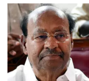
தரப்பில் போதிய உதவிகள் வழங்கப்படாததால், சில இடங்களில் உணவு கூடிகள்க்காமல் மக்கள் அவதிப்பட்டு வருகின்றனர். புதுவை, விழுப்புரம் மாவட்டத்தின் எல்லைப் பகுதியான கோட்டக்குப்பத்தில் வெள்ளம் போல் தண்ணீர் தேங்கியிருப்பதால் பல்லாயிரக்கணக்கான வீடுகளில் வசிக்கும் மக்கள் வெளியே வரமுடியாமல் தவித்துக் கொண்டிருக்கின்றனர். கடலூர், விழுப்புரம் மாவட்டங்களில் மழை வெள்ளம் போல் பாதித்த பகுதிகளில் மீட்புப் பணிகளை தமிழக அரசு விரைவுபடுத்த வேண்டும். பாதிக்கப்பட்ட மக்களுக்கு உணவு உள்ளிட்ட அத்தியாவசிய தேவைகளை உடனடியாக வழங்க வேண்டும். பயிர்களுக்கு ஏற்பட்ட

னால், திண்டிவனம், மயிலம், மரக்காணம், வாணூர் உள்ளிட்ட பகுதிகளில் கடுமையான பாதிப்புகள் ஏற்பட்டுள்ளன. திண்டிவனம் நகரத்தில் கிடங்கல் ஏரி உடைந்து ஊருக்குள் தண்ணீர் புகுந்துள்ளது. நகரின் பல பகுதிகள் வெள்ளக்காடாக காட்சியளிக்கின்றன. வீடு அணையிலிருந்து விளாடிக்கு 36 ஆயிரம் கன அடி தண்ணீர் திறந்து விடப்பட்டிருப்பதால் அப்பகுதியிலும் கடுமையான பாதிப்புகள் ஏற்பட்டுள்ளன. கடலூர் மாவட்டத்தில் பெரும்பான்மையான பகுதிகளில் வீடுகளுக்குள் தண்ணீர் புகுந்திருக்கிறது. பயிர்களுக்கும் கடுமையான பாதிப்புகள் ஏற்பட்டுள்ளன. மழையால் மக்களுக்கு ஏற்பட்டிருக்கும் கடுமையான பாதிப்புகளுக்கு அரசின் அலட்சியமும், செயலற்ற தன்மையும் தான் காரணம் ஆகும். திண்டிவனம் உள்ளிட்ட விழுப்புரம் மாவட்டத்தில் பல பகுதிகளில் வடிகால்கள் துர்வாரப்பாததும், ஆக்கிரமிப்புகள் அகற்றப்படாததும் தான் இந்த நிலைக்கு காரணம் என்று கூறப்படுகிறது. தழுவான பகுதிகளில் வாழும் மக்களுக்கு அரசுத்