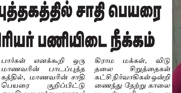
பார்கள் எனக்கூறி ஒரு மாணவரின் பாடப்புத்தகத்தில், மாணவரின் சாதி பெயரை குறிப்பிட்டு எழுதி அனைத்து மாணவர்கள் முன்னிலையில் தரக்குறைவாக பேசியதாக கூறப்படுகிறது. இதுகுறித்து அந்த மாணவன் வீட்டுக்கு சென்று பெற்றோரிடம் கூறி அழுதான். இதையடுத்து, 2 நாட்கள் கழித்து ஊர் பொதுமக்கள் பள்ளிக்கு சென்று ஆசிரியரிடம் இது தொடர்பாக கேட்டபோது, அவர் முறையான பதில் அளிக்கவில்லை எனக்கூறப்படுகிறது. பின்னர் குனிச்சி மோட்டுர் பகுதியைச் சேர்ந்த