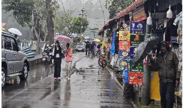
மழை கோட்டை அணிந்தபடியும் சிரமத்துடன் மாணவர்கள் பள்ளிக்கு சென்றனர். இடேபோல் அன்றாடம் விட்ட பகுதிகளிலும் தொடர் மழை நீடித்து வருவதால் மக்களின் இயல்பு வாழ்க்கை பாதிக்கப்பட்டுள்ளது.

திண்டுக்கல், நவ.29 குறைந்த காற்றழுத்த தாழ்வு மண்டலம் காரணமாக தமிழகத்தின் பல்வேறு மாவட்டங்களில் கனமழை பெய்து வருகிறது. திண்டுக்கல் மாவட்டத்துக்கு கன மழை எங்கே விடுக்கப்பட்டதா தலைமையிலும் நேற்று மாலை முதலே இடைவிடாமல் சாரல் மழை பெய்து வருகிறது.