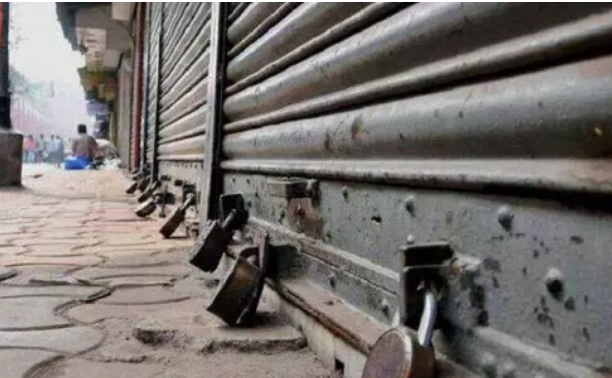
வந்துள்ள வாடகைக்கு 18 சதவீத ஜி.எஸ்.டி வரி விதிப்பினை கண்டித்து வருகிற 29ந்தேதி ஈரோடு மாவட்டம் முழுவதிலும் ஒருநாள் கடையடைப்பு, தொழில் நிறுவனங்கள் வேலை நிறுத்தம் செய்ய பது என முடிவு செய்யப்பட்டுள்ளது.

ஈரோடு, நவ.29 மத்திய அரசு கடைவாடகைக்கு 18 சதவீத ஜி.எஸ்.டி வரி விதிப்பை கட்டாத அட்டோபர் மாதம் 10ந்தேதி முதல் அமலாக்கி உள்ளது. இந்த முறையால் வணிகர்கள் பாதிக்கப்பட்டுவார்கள் என்பதால், இந்த வரி விதிப்பு முறையை முழுமையாக நீக்கம் செய்யக் கோரி வருகிற 29ம் தேதி (வெள்ளிக்கிழமை) ஒரு நாள் கடையடைப்பு நடத்த அறிவித்துள்ளனர்.