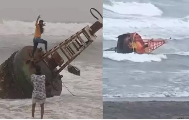
முது. ஃபெங்கல் புயல் காரணமாக சென்னையில் கடல் சீர்தரத்துடன் காணப்படுகிறது.

சென்னை, நவ.29 தென்மேற்கு வங்கக் கடலில் உருவாகியுள்ள ஆழ்ந்த காற்றழுத்த தாழ்வு மண்டலம் வடக்கு மற்றும் வடமேற்கு நோக்கி நகர்ந்து வருகிறது. இது அடுத்த 6 மணி நேரத்தில் (மாலை 5.30) மணிக்கு வடக்கு வடமேற்கில் நகர்ந்து சூறாவளி புயலாக (ஃபெங்கல் புயல்) வலுப்பெறும் என இந்திய வானிலை ஆய்வு மையம் தெரிவித்துள்ளது. இதன் காரணமாக தமிழக கடலோர மாவட்டங்களில் மழை பெய்து வருகிறது.