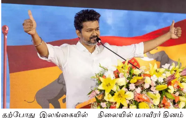
தற்போது இலங்கையில் புதிய அரசு அமைந்துள்ள நிலையில் மாவீரர் தினம் தடைபட்டுள்ளது.

சென்னை, நவ.29 இலங்கையில் ஈழ விடுதலைக்கு பாடுபட்டு உயிரிழந்தவர்களின் நினைவாக உலகம் முழுவதும் மாவீரர்கள் தினம் ஆண்டுதோறும் நவம்பர் 27ம் தேதி (இன்று) கடைபிடிக்கப்பட்டு வருகிறது. கடந்த சில ஆண்டுகளாக இலங்கையில் மாவீரர் தினம் கடைபிடிக்கப்படவில்லை.