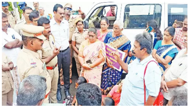
உடன் பட்டா வழங்குவ தற்கான ஆவணங்கள் தயார் செய்து அரசுக்கு அனுப்பி வைக்கப்பட்டது. இப்பகுதியில் வசிப்பவர்களுக்கு பட்டா வழங்க வலியுறுத்தி கடந்த 38 ஆண்டு காலமாக அரசிடம் வலியுறுத்தப்பட்டு வருகிறது. பல கட்ட போராட்டத்திற்குப் பிறகு தி.மு.க., ஆட்சி அமைந்த

திருப்பூர், நவ.29 திருப்பூர் மாநகராட்சிக்குப் பட்டா 55வது வார்டு பட்டுக் கோட்டையார் நகர்வடக்குபகுதியில் 192 குடும்பங்கள் 38 ஆண்டு காலமாக வசித்து வருகின்றனர். பல்வேறு பகுதிகளில் வெள்ளத்தால் பாதிக்கப்பட்டு, வீடு இல்லாமல் வாழ்விடத்திற்காக குடி பெயர்ந்தவர்கள் என ஏரா எமாளோர் இங்கு வந்து பல ஆண்டுகளாக வசித்து வருகின்றனர்.