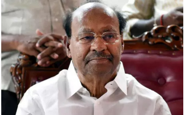
சாதிவாரி மக்கள்தொகை கணக்கெடுப்பை தமிழ்நாட்டில் நடத்த முடியுமா? அதற்கான மனதை வளம் தமிழ்நாட்டில் இல்லையா? அதற்கான நிதி தமிழ்நாட்டில் இல்லையா? எல்லாம் இருக்கிறது. ஆனால், ஆட்சியாளர்களுக்கு சமூகநீதி வழங்க வேண்டும் என்ற எண்ணம் மட்டும் தான் இல்லை.

சென்னை, நவ.29 பாமக நிறுவனர் ராமதாஸ் வெளியிட்டுள்ள எக்ஸ் தள பதிவில், தெலுங்கானாவில் கடந்த 6 ஆம் நாள் தொடங்கிய சாதிவாரி மக்கள் தொகை கணக்கெடுப்பு கட்ட 20 நாட்களில் 92% நிறைவடைந்து விட்டதாக அம்மாநில முதலமைச்சர் ரேவந்த் ரெட்டி கூறியிருக்கிறார்.