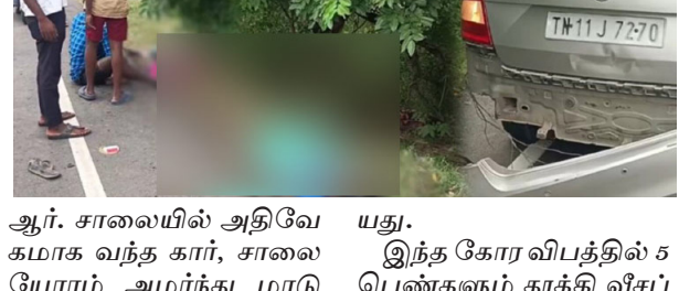
ஆர். சாலையில் அதிவேகமாக வந்த கார், சாலையோரம் அமர்ந்து மாடு மேய்த்துக்கொண்டிருந்த

செங்கல்பட்டு, நவ.29 சென்னை அருகே செங்கல்பட்டு மாவட்டம் மாமல்லபுரம் அருகே பண்டிதமேடு பகுதி உள்ளது. ஈ.சி.ஆர் சாலை அருகே இப்பகுதி அமைந்துள்ளது.