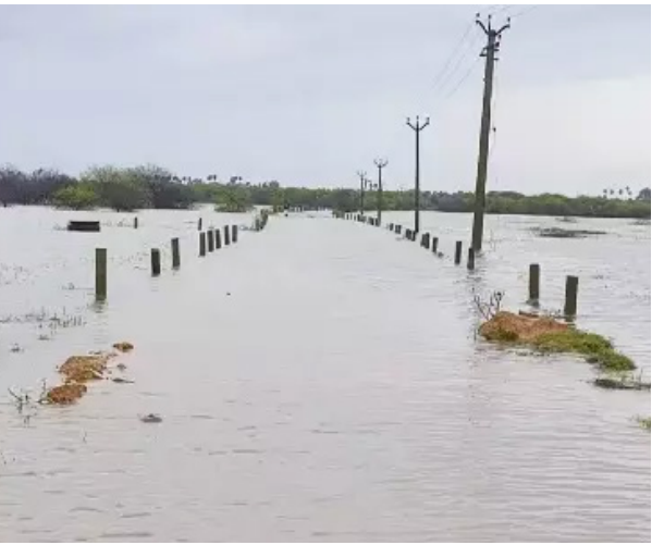
ஆலப்பாக்கம் கலியங்குப்பம், செய்யாங்குப்பம் போன்ற கிராமங்களில் 100 ஏக்கருக்கு மேல் சம்பா நெல் சாகுபடி செய்து மழை தண்ணீரில் மூழ்கி உள்ளன.

மரக்காணம், நவ.29 விழுப்புரம் மாவட்டம் மரக்காணம் பகுதிகளில் 19 மீனவ கிராமங்கள் 2வது நாளாக கடலுக்கு செல்லவில்லை. தற்போது மரக்காணம் பகுதிகளில் விவசாய நிலங்களின் மணிலா நெல்லு, மரவள்ளிக்கிழங்கு விவசாய நிலங்களில் பயிரிட்டு உள்ளார்கள். அது தற்போது மழையினால் மூழ்கியது. கந்தாடு வண்டிப்பாளையம் கிராமப்பக்கம், ஒம்பி பேர், நாமக்கல் மேடுகாயல், மேலே எட்சேரி, உப்பு வேலூர், கீழ்ப்பெட்டை, அனுமந்தை, கூனிமேடு, மண்டபாய்,