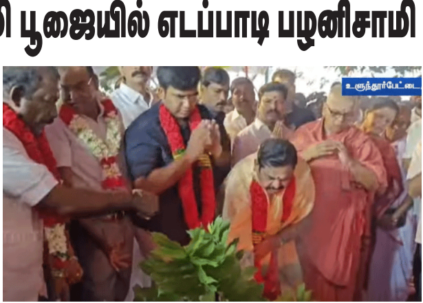
நடைபெற்றது. தேவமந்திரங்கள் முழங்க பட்டாச்சாரியர்கள் யாகம் நடைபெற்ற இந்த

கள்ளக்குறிச்சி, நவ.29 கள்ளக்குறிச்சி மாவட்டம் உள்நூர் பேட்டையில், திருப்பதி தேவஸ்தானம் சார்பில் ஏழுமலையான் கோவில் கட்டுமான பணி 20 கோடி ரூபாய் மதிப்பில், 5 ஏக்கர் பரப்பளவில் நடைபெற்று வருகிறது. இதில் 2 கோடி ரூபாய் மதிப்பில், கோவில் அன்னதான கூடம் கட்டுவதற்கான பூமி பூஜையை