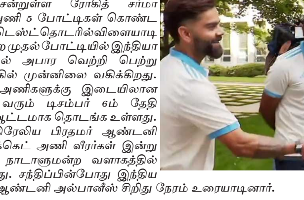
ஆஸ்திரேலிய பிரதமர் ஆண்டனி அல்பானீலை இந்திய கிரிக்கெட் அணி வீரர்கள் சந்தித்தனர்.

ஆஸ்திரேலியாவுக்கு சென்றுள்ள ரோகித் சர்மாதலைமையிலான இந்திய அணி 5 போட்டிகள் கொண்ட பாட்காவால்கோப்பை தொடரில் விளையாடி வருகிறது. இதில் நடைபெற்ற முதல் போட்டியில் இந்தியா 295 ரன்கள் வித்தியாசத்தில் அபார வெற்றி பெற்று தொடரில் 10 என்ற கணக்கில் முன்னிலை வகிக்கிறது.