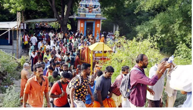
பக்தர்கள் மலையேறி சென்று சாமி தரிசனம் செய்ய இன்று (வியாழக் கிழமை) முதல் வருகிற 1ந் தேதி வரை அனுமதி வழங்கப்பட்டு இருந்தது.

விருதுநகர், நவ.29 விருதுநகர் மாவட்டத்தில் மேற்கு தொடர்ச்சி மலைப்பகுதியில் பிரசித்தி பெற்ற சதுரகிரி சுந்தரமகாலிங்க சுவாமி கோவில் அமைந்துள்ளது. இந்த கோவிலுக்கு மாதந்தோறும் அமாவாசை, பவுர்ணமி நாட்களில் பக்தர்கள் சென்று வழிபாடு நடத்த அனுமதி வழங்கப்பட்டு வருகிறது. அந்த வகையில், காத்திகை மாத பிரதோஷம் மற்றும் அமாவாசையை முன்னிட்டு சதுரகிரிக்கு