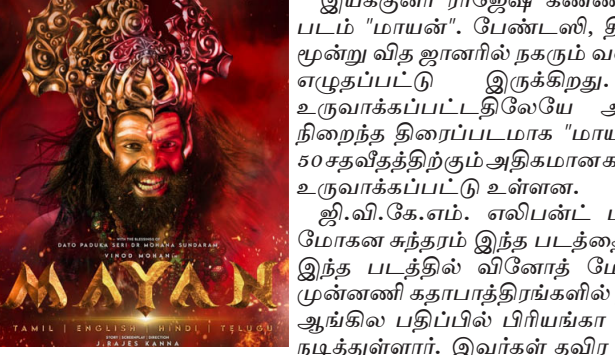
யு' சான்றிதழ் வழங்கிய தணிக்கை குழு