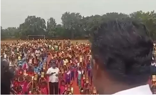
வாழ்த்து சொல்ல வைத்த தி.மு.க. நிர்வாகிகள்

தென்காசி, நவ.29 தமிழ்நாடு குடிநீர் திட்டம் திட்டமிடும் தி.மு.க. இளைஞரணி செயலாளருமான உதயநீதி ஸ்டாலின் இன்று தனது 47வது பிறந்த நாளை கொண்டாடி வருகிறார். அவருக்கு கட்சி நிர்வாகிகள், தொண்டர்கள், அரசியல் தலைவர்கள் என பலரும் பிறந்த நாள் வாழ்த்து தெரிவித்து வருகின்றனர்.