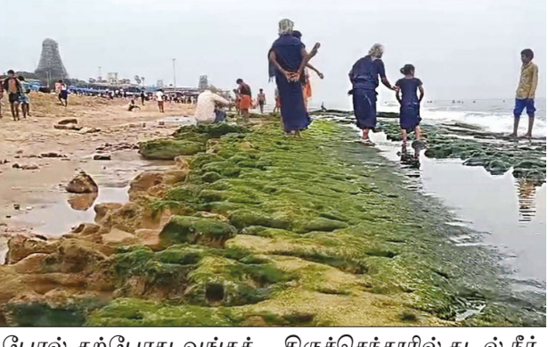
போல் தற்போது வங்கக் கடலில் காற்றழுத்த தாழ்வு மண்டலமும் தீவி நாளைக் கடல்நீர் சுமார் 100 அடி தூரம் உள்வாங்கியது.

திருச்செந்தூர், நவ.29 திருச்செந்தூர் சுப்பிரமணிய சுவாமி கோவிலுக்கும், அய்யாவைகுண்டர் அவதாரபதிக்கும் இடைப்பட்ட கடல் பகுதியில் ஒவ்வொரு மாதமும் வழக்கமாக அமாவாசை மற்றும் பவுர்ணமி நாட்கள், அதற்கு முன்னின்று, மறுநாள் கடல்நீர் உள்வாங்குவது வழக்கமான நிகழ்வாக நடைபெற்று வருகிறது.