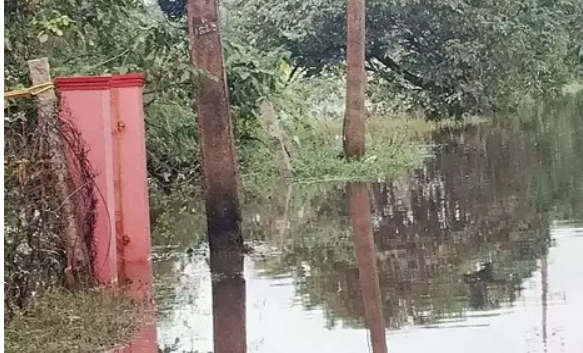
முழங்கால் அளவிற்கு குதி குடியிருப்பு வாசிகள் சூழ்ந்துள்ளதால் அப்பகுதியில் தவிப்பு

பொன்னேரி, டிச.10 மீஞ்சூர் பேரூராட்சிக் குடும்பம் 1வது வார்டு கலைஞர் நகர் முதல் தெரு, 2வது தெரு, ராஜேஸ்வரி நகர், பிரனாவந்தா பள்ளி தெரு மற்றும் நாலூர் ஊராட்சிக்கு உட்பட்ட கேசவபுரம் பகுதிகளில் 250க்கும் மேற்பட்ட வீடுகள் உள்ளன. பெருமழை புயல் காரணமாக மழை பெய்த நிலையில் மழை நீர் வெளியே முடியாமல் குடியிருப்பு பகுதியில்