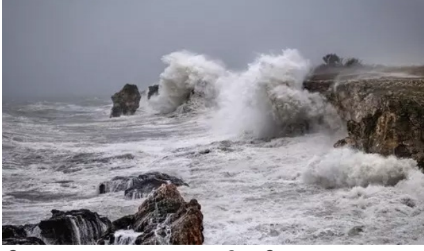
சென்னை மற்றும் சுற்று வட்டார பகுதிகளில் மழை பெய்தது. இந்நிலையில், தமிழகத்தில் சென்னை உள்பட 7 மாவட்டங்களுக்கு வெள்ள அபாய எச்சரிக்கை விடுக்கப்பட்டுள்ளது.

சென்னை, டிச.1 தமிழகத்தில் ஃபெங்கல் புயல் உருவாகியுள்ளது. இது இன்று பிற்பகலில் காலைக்காலம் மற்றும் மாலைப்பகுதி இடையே கரையை கடக்கிறது. இதனால் தமிழ்நாட்டில் 7 மாவட்டங்களுக்கு ரொட்டி அலர் எச்சரிக்கை விடுக்கப்பட்டுள்ளது. ஃபெங்கல் புயல் காரணமாக மணிக்கு 50 முதல் 90 கி.மீ. வேகத்தில் குறைந்த காற்றுடன் பலத்த மழைக்கு வாய்ப்புள்ளது. நள்ளிரவு முழுவதும்