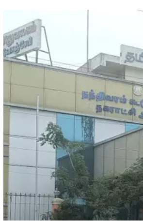
வண்ணப்பத்துடன் உரிய ஆவணங்களை வழங்கி, அதற்குரிய கட்டணம் செலுத்தி உரிமங்களை பெற்றுக் கொள்ள வேண்டும்.