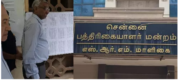
5 மணி வரை தாக்கல் செய்ய வேட்புமனு மீதான பரிசீலனை 9ந்தேதி பிற்பகல் 5 மணி முதல் மாலை 5 மணி வரை நடைபெறும். 10ந்தேதி வேட்புமனுக்களையும் கடைசியாக திரும்பப் பெறலாம். இறுதி வேட்பாளர் பட்டியல் 10ந்தேதி மாலை 6 மணிக்கு வெளியிடப்பட்டு 15ந்தேதி வாக்குப்பதிவுகளை அறிவிக்கப்படும்.