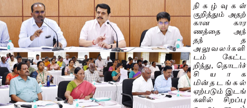
இதுதவிர்த்து சுமார் 2,927 கி.மீ. பழைய மின்கம்பிகள் புதியதாக மாற்றப்பட்டுள்ளன. ஆக மொத்தம் 13,73,051 சிறப்பு பராமரிப்பு பணிகள் நிறைவு செய்யப்பட்டுள்ளன.

சென்னை, நவ.9 தமிழக அரசு வெளியிட்டுள்ள செய்திக்குறிப்பில் கூறப்பட்டுள்ளதாவது: மின்சாரம், மதுவிலக்கு மற்றும் ஆயத்திரவத்துறை அமைச்சர் செந்தில் பாலாஜி இன்று (08.11.2024) சென்னை, தமிழ்நாடு மின்சார வாரிய தலைமையகத்தில் பருவமழைக்காலம் மற்றும் எதிர்வரும் கோடை காலத்தில் தமிழ்நாடு முழுவதும் சீரான மின்விநியோகம் வழங்குவதற்கு தமிழ்நாடு மின் பகிர்மானக் கழகம் சார்பாக மேற்கொள்ளப்பட்டுள்ள நடவடிக்கைகளை குறித்து அனைத்து மண்டல தலைமை பொறியாளர்கள் மற்றும் மேற்பார்வைப் பொறியாளர்களுடன் விரிவான ஆய்வு மேற்கொண்டார். தமிழ்நாடு முழுவதும் 6,68,225 ஒருக்கிணைந்த சிறப்பு பராமரிப்பு பணிகள் திட்டமிடப்பட்டு, கடந்த 01.07.2024 முதல் 15.10.2024 வரை மொத்தமாக 13,73,051 சிறப்பு பராமரிப்பு பணிகள் நிறைவு செய்யப்பட்டுள்ளன. அதிலும், குறிப்பாக, 47,380 மின்கம்பங்கள் மாற்றப்பட்டிருக்கின்றன, சாய்ந்த நிலையில் இருந்த 33,494 மின்கம்பங்கள் சரிசெய்யப்பட்டிருக்கின்றன, புதியதாக 27,329 மின்கம்பங்கள் இடைசெருகல் செய்யப்பட்டிருக்கின்றன. 2,17,775 இடங்களில் பலவீனமான இன்கலேட்டர்கள் மாற்றப்பட்டிருக்கின்றன, 41,508 இடங்களில் மின்கம்ப தாங்கு கம்பிகள் புதுப்பிக்கப்பட்டிருக்கின்றன, பழுதடைந்த 7,118 இடங்களில் பில்லர் பாக்கல்கள் சரிசெய்யப்பட்டுள்ளன,