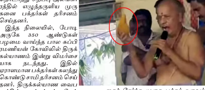
தேனி சேர்ந்த முருக பக்தர் ஒருவர் ரூ.3 லட்சத்திற்கு ஏலத்தில் எடுத்து வாங்கி சென்றார். ஏலத்தொகையை

தேனி, நவ.9 முருகன் கோவில்களில் நடைபெறும் விழாக்களில், கந்தசஷ்டி விழா சிறப்பு வாய்ந்தது ஆகும். அதன்படி, தமிழகம் முழுவதும் உள்ள அனைத்து முருகன் கோவில்களிலும் கடந்த 2ந்தி கந்தசஷ்டி விழா தொடங்கியது. கந்த சஷ்டி விழா வின் சிகரநிகழ்ச்சியாக கருதப்படும் குரசம்ஹாரம் நிகழ்ச்சி நேற்று கோலாகலமாக நடந்தது. தேனி மாவட்டத்தில் உள்ள முருகன் கோவில்களிலும் திரளான பக்தர்கள் முன்னிலையில் குரசம்ஹாரம் அரோகார கோஷம் முழங்க நடைபெற்றது. குரசம்ஹாரத்தை