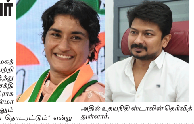
அதில் உதயநிதி ஸ்டாலின் தெரிவித்துள்ளார்.

வில் ஜூலானா சட்டமன்றத் தொகுதியில் வெற்றி பெற்றதற்காக இந்தியாவின் நட்சத்திர வீராங்கனையும் காங்கிரஸ் வேட்பாளரான வினேஷ் போகத்துக்கு எனது மன மாற்ற வாழ்த்துக்கள். மக்கள் பிரதிநிதியாக மக்கள் சேவையின் இந்திய அத்தியாயத்தில் அவர் மகத்தான வெற்றி பெற வாழ்த்துகள். பாசிச சக்திகளுக்கு எதிராக அவரது ஆன்மாவும் ஆற்றலும் அவரை பின் தொடரட்டும்" என்று