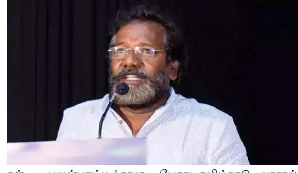
பெருளாதாரம். நம் மகிழ்ச்சிக்காகப் பட்டாசு தயாரிக்கும் தொழிலாளர்களின் வாழ்வாதாரத்துக்காக, நாம் அனைவரும், நம்மால் முடிந்த அளவுக்குப் பட்டாசு வாங்கி வெடிக்க வேண்டுமென்று கேட்டுக் கொள்கிறேன். மத்தாப்புக்களின் வெளிச்சம் போல, இந்த தீபாவளிப் பண்டிகை, அனைவரின் வாழ்விலும் ஒளி ஏற்றும் தீபாவளியாக அமையட்டும். அனைவருக்கும் தீபாவளி நல் வாழ்த்துக்கள்.

சென்னை, அக். 31 முக்குலத்தோர் புலிப் படை தலைவர் கருணாஸ் வெளியிடப்பட்டுள்ள அறிக்கையில் கூறியிருப்பதாவது: முத்துராமலிங்க தேவர் நினைவை போற்றும் வண்ணம், அக்டோபர் 30ந் தேதி தேவர் ஜெயந்தி விழாவை தமிழ்நாடு அரசு விழாவாக கொண்டாடப்படுகிறது. ஒவ்வொரு ஆண்டும் ஜெயந்தி விழா நடைபெறும் சூழலில் அவரது நினைவிடம் அருகில் பொதுமக்கள்