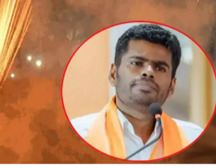
இவ்வாறு அதில் தெரிவிக்கப்பட்டுள்ளது.

பொருளாதாரம். நம் மகிழ்ச்சிக்காகப் பட்டாசு தயாரிக்கும் தொழிலாளர்களின் வாழ்வாதாரத்துக்காக, நாம் அனைவரும், நம்மால் முடிந்த அளவுக்குப் பட்டாசு வாங்கி வெடிக்க வேண்டுமென்று கேட்டுக் கொள்கிறேன். மத்தாப்புக்களின் வெளிச்சம் போல, இந்த தீபாவளிப் பண்டிகை, அனைவரின் வாழ்விலும் ஒளி ஏற்றும் தீபாவளியாக அமையட்டும். அனைவருக்கும் தீபாவளி நல் வாழ்த்துக்கள்.