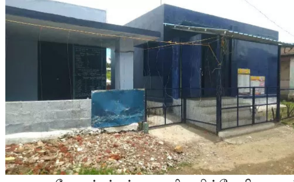
சூரிய மின்வேலி அமைக்கப்பட்டுள்ளது. மேலும் கம்பி வலை, இரும்பு கேட்ட, இரும்பு ஷட்டர் என மூன்று அடுக்கு பாதுகாப்பு வளையம் அமைக்கப்பட்டுள்ளது.

கோவை மாவட்டம் ஆணைமலை புவிகள்காப்பக்கு உட்பட்ட வால்பாறை ஆகிய இடங்களில் இந்த பாதிப்பு அதிகளவில் உள்ளது.