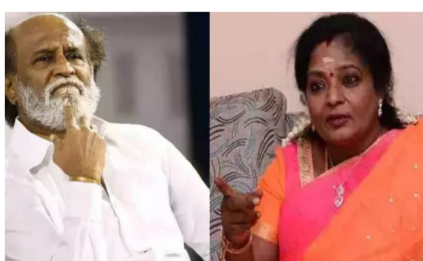
நிகழ்ச்சியில் பங்கேற்ற நடிக்காரர் ரஜினிகாந்த் திமுக ஆலமரம் போன்றது எனக் கூறியிருந்தார். அப்படி தான் தெலுங்கானாவிலும் ஆந்திராவிலும் ஆலமரம் என்றார்கள். அங்கு ஆட்சி மாறி இருக்கிறது. ரஜினி காந்த் தி.மு.க.வில் புயலையும் சுனாமியையும் உருவாக்கி இருக்கிறார்.

சென்னை, ஆக. 28 நாடு முழுவதும் கிருஷ்ண ஜெயந்தி இன்று கோலாகலமாக கொண்டாடப்பட்டு வருகிறது. இதனை முன்னிட்டு சென்னை கோயில்களில் பக்தியில் உள்ளவர்களுக்கு கோபால சுவாமி கோவிலில் பா.ஜ.க. மூத்த தலைவர் தமிழிசை சுவாமிநாதன் சாமி தரிசனம் செய்தார். பின்னர் நிருபர்களுக்கு பேட்டியளித்தார். அப்போது அவர் கூறியதாவது: 'திருவிடை முன்னேற்ற கழகம் ஆட்சியில் இருந்து இறங்க வேண்டும் என்பதே எங்களது ஒற்றை குறிக்கோள். செப்டம்பர் 25 வரை எங்களது முழு கவனம் உறுப்பினர்