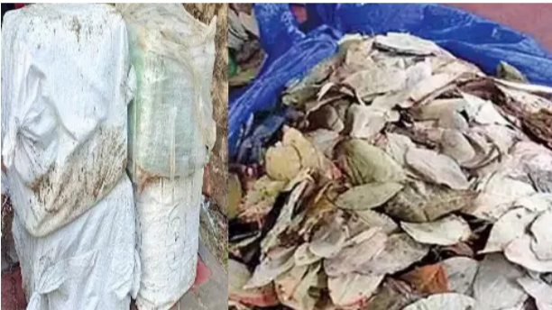
ரவில் சந்தேகத்திற்கு இடமாக நின்று லோடு ஆட்டோவை சோதனை செய்தனர்.

தூத்துக்குடி, ஆக. 28 தூத்துக்குடி திருேல்புரம் கடற்கரை வழியாக பீடி இலை மூட்டைகள் கடத்தப்பட்டிருப்பதாக போலீசாருக்கு ரகசிய தகவல் கிடைத்தது.