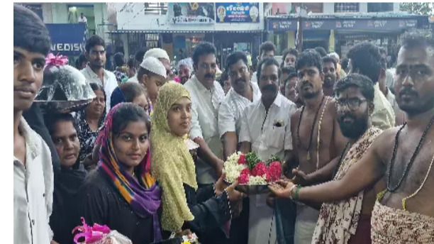
இந்நிலையில் காலை, மாலை என கடந்த 15 நாட்களாக பூஜை நடந்து வந்த நிலையில் வடமேலம்பட்டி கிராமத்தில் உள்ள இஸ்லாமிய மக்கள் சுமார் 300க்கும் மேற்பட்ட குடும்பத்தினர் சாமிக்கு சீர்வரிசை எடுத்து வந்து அம்மனுக்கு பூஜை செய்தனர்.

போச்சம்பள்ளி, ஆக. 28 கிருஷ்ணகிரி மாவட்டம் போச்சம்பள்ளி அடுத்த வடமேலம்பட்டி கிராமத்தில் கந்த மாரியம்மன் கோவில் உள்ளது. இந்த கோவிலை புறநகரம் மக்கள் தீர்மானித்து கோவில் கட்டுமான பணிகள் மற்றும் வண்ணம் தீட்டும் பணிகளை செய்து வந்தனர்.