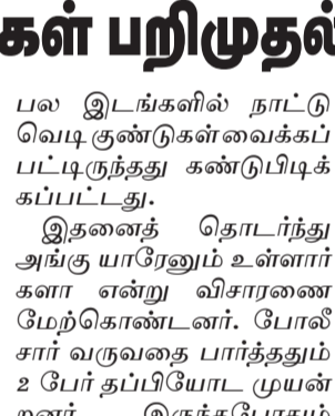
பெரியகுளம், ஆக. 28 தேனி மாவட்டம் பெரியகுளம் வடகரை காடு வெட்டி பகுதியில் பெரியகுளம் அரண்மனைக்கு செந்தமரான புளியந்தோப்பு உள்ளது. இந்த பகுதியில் வனவிலக்குகளை வேட்டையாடுவதற்காக மாட்டு கொழுப்புக்குள் நாட்டு வெடிகுண்டுகளை உள்ளே வைத்து பல இடங்களில் வைத்துள்ளதாக தகவல் கிடைத்தது. இதனை பார்த்த அப்பகுதி விவசாயிகள் கிராம காவல் தலைவருக்கு புகார் தெரிவித்தனர். இதனை தொடர்ந்து கிராம காவல் குழுவினர் சம்பவ இடத்திற்கு சென்று சோதனை நடத்தினர். அப்போது விலக்குகளை வேட்டையாடுவதற்காக புளியந்தோப்பு பகுதியில்