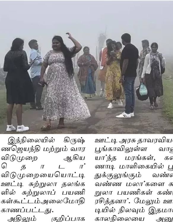
இந்நிலையில் கிருஷ்ணஜெயந்தி மற்றும் வார விடுமுறை ஆகிய விடுமுறையை யொட்டி ஊட்டி சுற்றுலா பயணிகளின் கருவியை கைகூட்டும் அலைமோதி காணப்பட்டது.

ஊட்டி, ஆக. 28 மலைகளின் அரகி என அழைக்கப்படும் நீலகிரி மாவட்டத்திலுள்ள சுற்றுலா தலங்களை காண கேரளா, காநடகா மற்றும் சமவெளி பிரதேசங்களில் இருந்து நாள்தோறும் ஆயிரக்கணக்கான சுற்றுலாப்பயணிகள் வந்து செல்கின்றனர்.