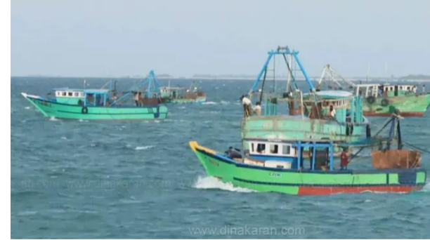
கடற்படையால் தமிழ்நாடு மீனவர்கள் மீண்டும் கைது செய்யப்பட்டுள்ள சம்பவம் அதிர்ச்சியை ஏற்படுத்தியுள்ளது.

ராமேஸ்வரம், ஆக. 28 தமிழ்நாட்டைச் சேர்ந்த 8 மீனவர்களை இலங்கை கடற்படை கைது செய்தது. இலங்கை கடற்படையின் அத்துமீறலால் தமிழ்நாடு மீனவர்கள் பாதிக்கப்படுவது தொடர்கதையாக வருகிறது.