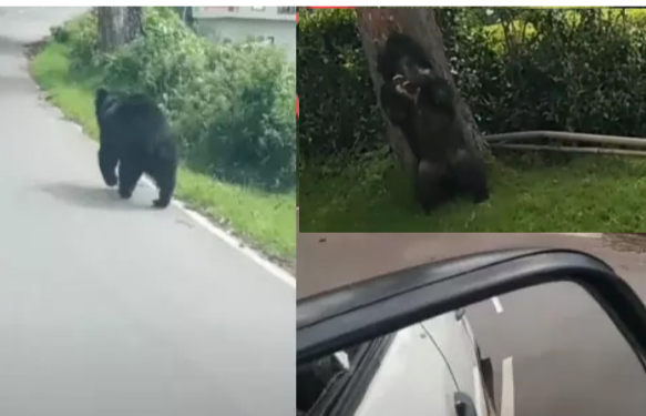
பதிவு செய்தனர். இதனை பார்த்த கரடி "நான் சும்மா தானே போய்கிட்டு இருக்கேன், என்னை ஏன்டா தொந்தரவு பண்ணிங்க" என்பது போல் கையெழுத்து பிட்ட காட்சிகள் பதிவு செய்தனர்.

ஊட்டி, ஆக. 28 நீலகிரி மாவட்டத்தில் சமீப காலமாக வனவிலங்குகள் உணவு மற்றும் தண்ணீர் தேடி மலையடிவாரங்களில் இருக்கும் குடியிருப்பு பகுதிகளுக்கு வந்து செல்வது வழக்கமாகி விட்டது.