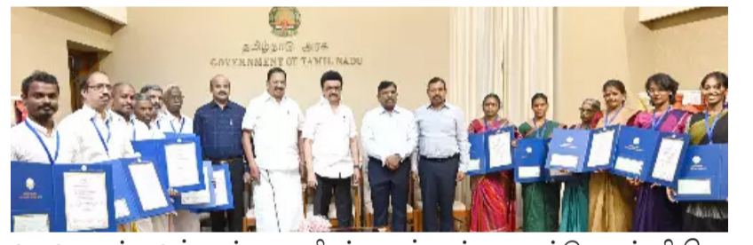
வடிவமைப்பாளர்களுக்கு பரிசுத்தொகையாக 2.25 லட்சம் ரூபாய்க்கான காசோலைகள் மற்றும் பாராட்டுச் சான்றிதழ்களையும் வழங்கி சிறப்பித்தார். இப்பணிகளில் நாட்டு நலப்பணித்திட்ட மாணவர்கள், மகளிர் சுய உதவிக்குழு உறுப்பினர்கள், தன்னார்வலர்கள் ஈடுபடுத்தப்பட்டுள்ளனர் என ஆட்சியர் மகாபாரதி தெரிவித்தார்.

சென்னை, செப்டம்பர் 27, சென்னை. முதலமைச்சர் மு.க.ஸ்டாலின் இன்றுதலைமைச் செயலகத்தில், 202324ம் ஆண்டிற்கான பட்டு மற்றும் பருத்தி ரகங்களில் சிறந்த கைத்தறி நெசவாளர் விருதுக்கு தேர்வு செய்யப்பட்ட 6 விருதாளர்களுக்கு பரிசுத்தொகையாக 20 லட்சம் ரூபாய்க்கான காசோலைகள் மற்றும் பாராட்டுச் சான்றிதழ்களையும், சிறந்த வடிவமைப்பாளர் விருதுக்கு தேர்வு செய்யப்பட்ட 3 வடிவமைப்பாளர்களுக்கு பரிசுத்தொகையாக 40 ஆயிரம் ரூபாய்க்கான காசோலைகள் மற்றும் பாராட்டுச் சான்றிதழ்களையும், போட்டி தேர்வு மூலம் சிறந்த இளம் வடிவமைப்பாளர் விருதுக்கு தேர்வு செய்யப்பட்ட 3