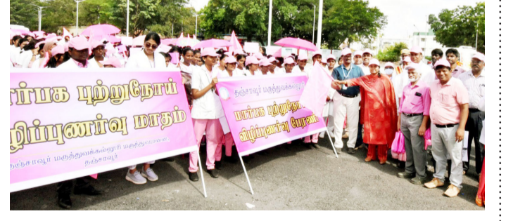
மார்க்க புற்றுநோய் விழிப்புணர்வு மாநாடு