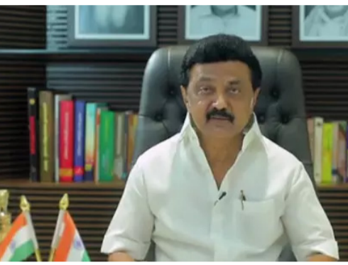
மண்டல வளாகத்தில் ரூ.114.16 கோடி மதிப்பில் இந்த புதிய ஐ.டி. பார்க் கட்டப்பட்டது. இதை முதல மைச்சர் திறந்துவைத்து ஐ.டி. பொறி

கோவை, அக். 25 முதலமைச்சர் மு.க.ஸ்டாலின் நேற்று நாமக்கல் மாவட்டத்தில் ஆய்வு மேற்கொண்டு பொதுமக்க ளுக்கு அரசு நலத்திட்ட உதவிகளை வழங்கினார். விழாவில் அவர் பேசுகையில் அடுத்த மாதம் முதல் அனைத்து மாவட்டங்களிலும் நடைபெற்று வரும் அரசு திட்டப்பணிகளை நேர டியாக சென்று பார்வையிட்டு கள ஆய்வு செய்யப்போவதாக அறிவித் தார். அதன்படி முதல் பயணமாக முத லமைச்சர் மு.க.ஸ்டாலின் நவம்பர் மாதம் கோவை வருகிறார். காந்திபு ரத்தில் 6.9 ஏக்கர் பரப்பளவில் ரூ.300 கோடியில் கருணாநிதி நூற்