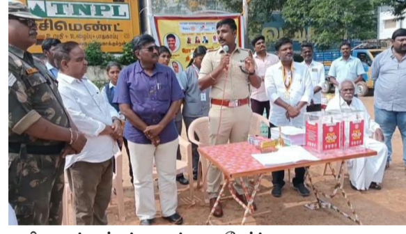
டரி நண்பர்கள் ஒன்று சேர்ந்து போலியோ சொட்டு மருந்தை உல கொடுத்துக்கொண்டு இருப்பதாக

திருக்கோவிலூர், அக். 25 உலக போலியோ தினத்தை முன் னிட்டு ரோட்டரி கிளப் திருக்கோவிலூர் டெம்பிள் சிடடி சார்பில் போலியோ ஒழிப்பு விழிப்பு ணர்வு மற்றும் நிதி திரட்டும் நிகழ்ச்சி நடைபெற்றது. உலகமெங்கும் போலியோவை ஒழிப்பதில் ரோட்டரி சங்கம் தான் போலியோ சொட்டு மருந்தை உல கத்தில் உள்ள அனைத்து நாடுகளுக் கும் அரசாங்கத்துடன் இணைந்து உலகத்தில் உள்ள அனைத்து ரோட்