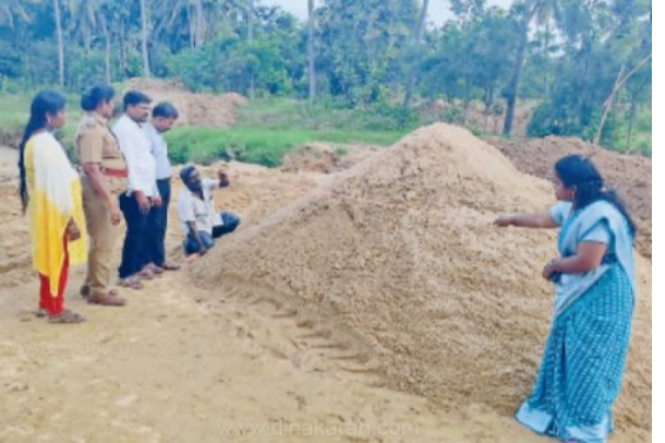
குள்ள அணை மற்றும் நீர்வரத்து கால்வாய்களில் மணல் அள்ளி விற்று வருகின்றனர். குறிப்பாக டேம் அருகே விவசாய நிலங்கள் மற்றும் அரசுக்கு சொந்தமான இடங்களில் உள்ள மணல் மற்றும் மணலை செயற்கையாக தயாரித்து விற்று வருகின்றனர். இதுதொடர்பாக அபிவிருத்தி தகவலின்பேரில் சில வாரங்களுக்கு முன்பு அதிகாரிகள் ஆய்வு செய்து, செயற்கை மணல்தயாரிக்கும் தொட்டிகளை அகற்றினர். இந்நிலையில் அரசு அதிகாரிகளுக்கு தெரி

நாடறம்பள்ளி, அக். 24 நாடறம்பள்ளி அருகே 3 யூனிட் செயற்கை மணலை அதிகாரிகள் பறிமுதல் செய்தனர். திருப்பத்தூர் மாவட்டம் நாடறம்பள்ளி அடுத்த வெலக்கல் நத்தம் ஊராட்சியில் அமைந்துள்ள செட்டேரி டேம் பகுதியை சுற்றிலும் பல ஏக்கர் பரப்பளவில் விவசாய நிலங்கள் உள்ளது. 10 ஆண்டுகள் இடைவெளிக்கு பிறகு கடந்த 2 ஆண்டுகளுக்கு முன்பெய்த மழைக்காரணமாக செட்டேரி அணை நிரம்பியது. இதனால் விவசாய பணிகள் மீண்டும் களைகட்ட தொடங்கியது. இந்நிலையில் மணல் மாலியா கும்பல், அங்குள்ள அணை மற்றும் நீர்வரத்து கால்வாய்களில் மணல் அள்ளி விற்று வருகின்றனர். குறிப்பாக டேம் அருகே விவசாய நிலங்கள் மற்றும் அரசுக்கு சொந்தமான இடங்களில் உள்ள மணல் மற்றும் மணலை செயற்கையாக தயாரித்து விற்று வருகின்றனர்.