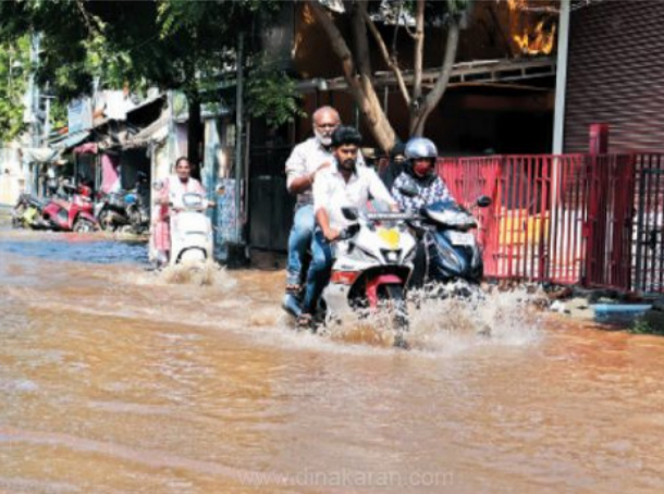
மழைநீர் தேங்கி நிற்கிறது. இதனால், பொதுமக்கள் பாதிக்கப்பட்டுள்ளனர். இந்நிலையில், நேற்று பெய்த மழையால் செல்லூர் பந்தல் குடியாக வாயில் நேற்று இரவு

மதுரை, அக். 24 தமிழ்நாட்டில் வடகிழக்கு பருவமழை தொடங்கி மதுரை உள்ளிட்ட தென்மாவட்டங்களில் தொடர்மழை பெய்து வருகிறது. இதனால், பல்வேறு இடங்களில் உள்ள கண்மாய்கள், ஊருணிகள் நிரம்பி வருகின்றன. மதுரை மாவட்டத்தை பொருத்தவரை கடந்த ஞாயிறுக்கிழமை இரவும், நேற்றும் நள்ளிரவில் பலத்த மழை கொட்டித் தீர்த்தது. இதனால், சாலைகளில் வெள்ளம் ஓடியது. தாழ்வான பகுதிகளில் தண்ணீர் தேங்கியது. குறிப்பாக மதுரையில் உள்ள செல்லூர் 50 அடி கோடு, சுயராஜ்ஜியபுரம் பகுதிகளில், பல்வேறு தெருக்களில் மழைநீர் தேங்கி நிற்கிறது.