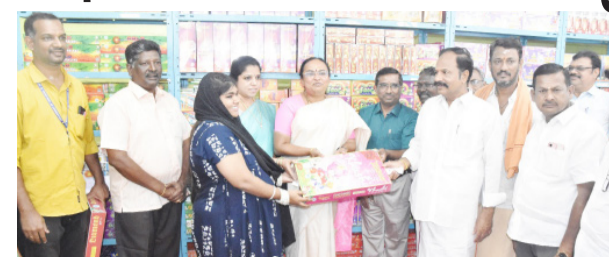
சுயசேவைப் பிரிவுகளில் வாடிக்கையாளர்கள் நலன்கருதி அதிகப்படியான சில்லரை விலையை விட்டு குறைவான விலைக்கே மளிகை பொருட்கள் மற்றும் அழகு சாதன பொருட்கள் விற்பனை செய்யப்பட்டு வருகிறது. மேலும் விவசாயிகளிடம் நேரடி கொள்முதல் செய்யப்பட்ட பண்ணை பசுமை காய்கறி கடை செயல்பட்டு வருகிறது. தற்பொழுது தீபாவளி பண்டிகையை முன்னிட்டு பொதுமக்களுக்கு தரமான பட்டாசு பொருட்களை குறைந்த விலையில் விற்பனை செய்யும் நோக்கில் தீபாவளி சிறப்பு விற்பனை தொடங்கப்பட்டுள்ளது. கடந்த ஆண்டு கற்பகம் கூட்டுறவு சிறப்பங்காடியின் மூலம் ரூபாய் 85 லட்சத்திற்கு பட்டாசு விற்பனை மேற்கொள்ளப்பட்டது. இந்த ஆண்டு ரூபாய் 1 கோடி அளவிற்கு பட்டாசு விற்பனை செய்ய திட்டமிடப்பட்டுள்ளது. மொத்தமாக கொள்முதல் செய்யும் நிறுவனங்களுக்கு ஆர்டரின் பெயரில் டோர் டெலிவரி வழங்கப்படும். மேலும் கிட்டி பாக்ஸ் களுக்கு கூடுதலாக 5% விலை குறைப்பு விற்பனை செய்யப்படும். இங்கு குழந்தைகளை மகிழ்விக்கும் வகையில் வண்ண மத்தாப்புகள், வான வேடிக்கைகள், பல்வேறு

வேலூர், அக். 24 வேலூர் மாவட்ட நுகர்வோர் கூட்டுறவு விற்பனை பண்டக சாலை 14.12.1942ல் பதிவு செய்யப்பட்டு 27.01.1943 முதல் பணி தொடங்கப்பட்டு 81 ஆண்டுகளாக நல்ல முறையில் செயல்பட்டு வருகிறது. இப்பண்டகசாலையில் 2 சய சேவை பிரிவுகள், 2 கூட்டுறவு மருந்து விற்பனை பிரிவுகள், 5 அம்மா சிறு கூட்டுறவு சிறப்பங்காடிகள், 5 பெட்ரோல் வழங்கு நிலையங்கள், 4 மினி தீபம் மார்க்கெட், 147 நியாய விலைகடைகள் ஆகியவை இப்பண்டகசாலையின் கீழ் மக்களுக்கு சேவையாற்றி செயல்பட்டு வருகின்றன. இப்பண்டகசாலையில் தலைமையகத்தில் கூட்டுறவு மருந்து விற்பனை பிரிவுகளில் விற்பனை செய்யப்பட்டு அனைத்து மருந்துகளுக்கும் 20 சதவீதம் வரை தள்ளுபடி வழங்கி பொதுமக்களுக்கு சிறப்பு விற்பனை தொடங்கப்பட்டுள்ளது.