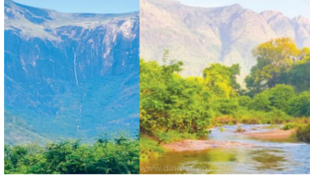
யில் நேற்று இரவு 8 மணி முதல் இன்று அதிகாலை 2 மணி வரை இடி, மின்னலுடன் பலத்த மழை பெய்தது. இதனால், மலையடி

ஸ்ரீவில்லிபுத்தூர், அக். 24 ஸ்ரீவில்லிபுத்தூர் அருகே, மேற்குத் தொடர்ச்சி மலைப்பகுதியில் பெய்த மழையால், நீரோடைகளில் நீர்வரத்து அதிகரித்துள்ளது. இதனால், கண்மாய் பாசன விவசாயிகள் மகிழ்ச்சி அடைந்துள்ளனர். விருதுநகர் மாவட்டம், ஸ்ரீவில்லிபுத்தூர் அருகே, மேற்குத் தொடர்ச்சி மலையில் இன்று அதிகாலை 2 மணி வரை இடி, மின்னலுடன் பலத்த மழை பெய்தது. இதனால், மலையடி