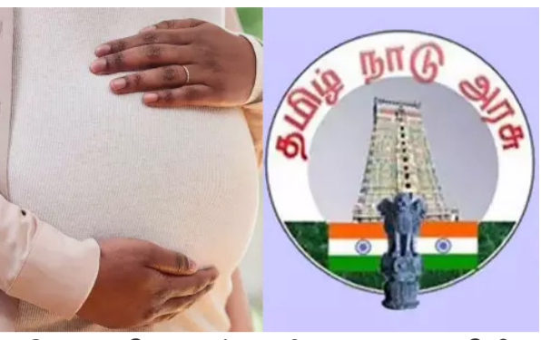
அரசின் அதிகாரப்பூர்வ மீட்டுள்ள பதிவில், "கடந்த 2001ம் ஆண்டில் த மி ழ் ந ா ட் டி ல் வல் சரிபார்ப்பகம் வெளி

சென்னை, நவ.24 கடந்த 20 ஆண்டுகளில் பிரசவத்தின்போது தாய்மார்களின் இறப்பு விகிதம் அதிகரித்துள்ளதாகவும், அரசு ஆஸ்பத்திரிகளில் இதுவரை இல்லாத அளவுக்கு டாக்டர்கள் பணியிடம் காலியாக இருப்பதாகவும் சமூக வலைத்தளங்களில் ஒரு தகவல் வெகமாக பரவ வருகிறது. இதனை தமிழக அரசு மறுத்துள்ளது. இதுதொடர்பாக தமிழக