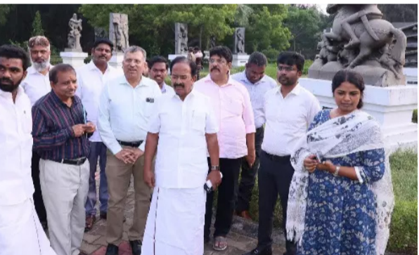
பேருந்து நிலையம் அருகே மரகத பூங்காவில், ரூ.8 கோடி மதிப்பீட்டில் 10 லட்சம் விளக்குகள் மூலம் ஒளிரும் தோட்டம் அமைக்கும் பணி மற்றும் 5 கோடி மதிப்பீட்டில் தலையணை பெருமான் கோயில்

மாமல்லபுரம், நவ.24 மாமல்லபுரம் கிழக்கு கடற்கரை சாலையில் தமிழ்நாடு சுற்றுலா வளர்ச்சி கழக விடுதி செயல்பட்டு வருகிறது. இந்த விடுதிக்கு சுற்றுலாத்துறை அமைச்சர் ராஜேந்திரன் திடர் ஆய்வு செய்தார். அப்போது பயணிகள் தங்கும் அறைகள், நீச்சல்குளம், கழிப்பறைகள், கட்டிடங்கள், சமையல் கூடம் மற்றும் வளாகத்தில் உள்ள செம்மொழி சிற்ப பூங்கா ஆகியவற்றை பார்வையிட்டார். பூங்காவை பராமரித்து பிரபலமாக்க அறிவுறுத்தினார். பின்னர், மாமல்லபுரத்தில் பழைய சுற்றுலா வளர்ச்சி கழக விடுதி,