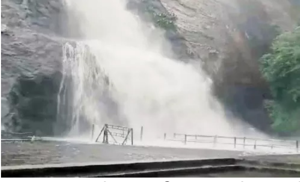
றால் அருவிகளான மெயின் அருவி, ஐந்தருவி