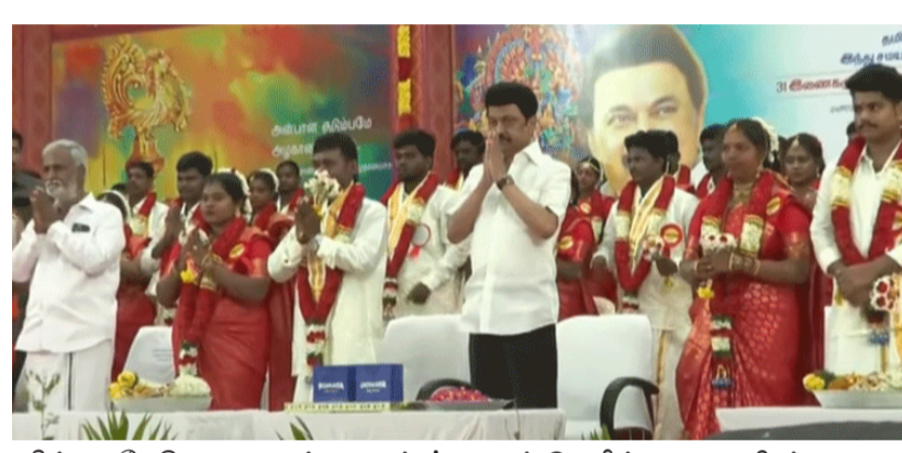
வில் பேசிய முதல் அமைச்சர் ஆண்டுகளில் 2 ஆயிரத்து 226 மு.க. ஸ்டாலின், "அறநிலையத்துறை செயல்பாடுகளை உண்மையான பக்தர்கள் பாராட்டுகின்றனர். திருமுக ஆட்சிப் பொறுப்பேற்று 3 அனுமதி வழங்கப்பட்டு 9 ஆயிரம்

சென்னை, அக். 22 தமிழகம் முழுவதும் அறநிலையத்துறை சார்பில் இன்று 304 ஜோடிகளுக்கு திருமணம் நடைபெறுகிறது. இந்நிலையில் திருவான்மியூரில் இந்து சமய அறநிலையத்துறை சார்பில் நடைபெற்ற விழாவில் 31 ஜோடிகளுக்கு முதல் அமைச்சர் மு.க. ஸ்டாலின் திருமணம் நடத்தி வைத்தார். அப்போது அறநிலையத்துறை சார்பில் 4 கிராம தங்கத் தாலி மற்றும் கட்டில், மெத்தை, பீரோ உள்ளிட்ட பொருட்கள் அடங்கிய ரூ.60 ஆயிரம் மதிப்பிலான சீர்வரிசை மணமக்களுக்கு வழங்கப்பட்டது. புதுமணத் தம்பதிகளுக்கு சீர்வரிசைகளை வழங்கிய முதல் அமைச்சர் மு.க. ஸ்டாலின் அவர்களுக்கு வாழ்த்து தெரிவித்தார் இதனைத் தொடர்ந்து அந்த நிகழ்