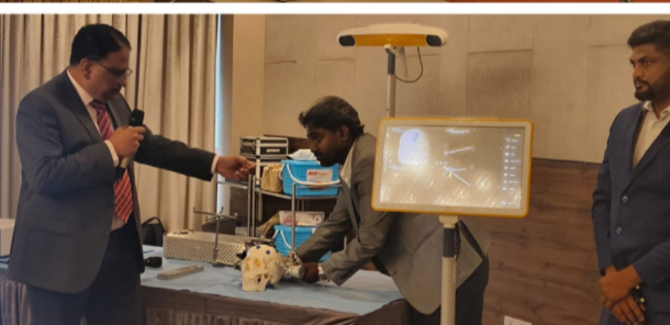
துல்லியமாக கண்டறிந்து அகற்றப்படுகிறது. அதன் பின்பு நோயாளிக் குழு மூளையான கதிர் இயக்க சிகிச்சை நரம்பியல் நிபுணர்கள், கதிரியக்க