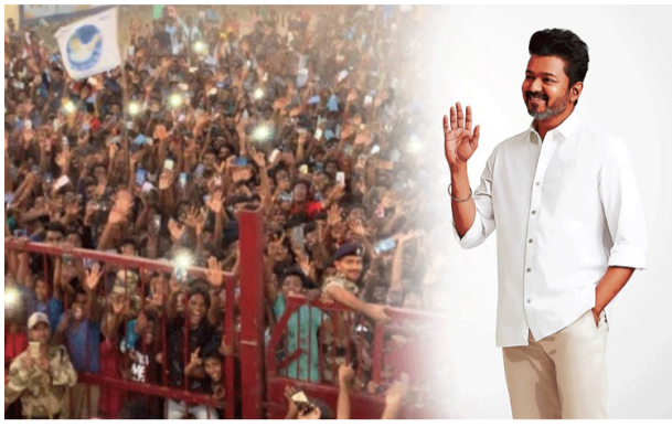
முதல் மாநாட்டில் விஜய் திடீர் உத்தரவு பற்றி உறுதியளித்துள்ளார்.

சென்னை, அக். 2 தமிழக வெற்றிக்கழகத்தின் முதல் மாநாடு 27 தேதி விக்கிரவாண்டியில் நடைபெறும். விக்கிரவாண்டியில் நடைபெறும் இந்த மாநாட்டில் தான் கட்சியின் கொடியின் அர்த்தத்தை விஜய் அறிவிப்பார் என்று எதிர்பார்க்கப்படுகிறது. மேலும், கட்சியின் கொள்கைகளும் இந்த மாநாட்டில் தான் அறிவிக்கப்பட உள்ளது. இதனால் விஜய் கட்சியின் தொண்டர்கள் இந்த மாநாட்டை எதிர்நோக்கிக்காத்திருக்கிறார்கள்.