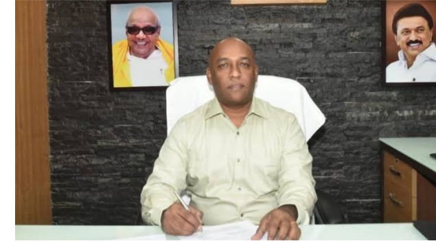
05.10.2024 (சனிக்கிழமை) அன்று காலை 9.00 மணி முதல் மதியம் 3.00 மணி வரை விழுப்புரம் மாவட்டத்தில் உள்ள அறிஞர் அண்ணா அரசு கலை மற்றும் அறிவியல் கல்லூரியில் நடைபெறுவது. இம்முகாமில் உற்பத்தி, தகவல் தொழில்நுட்பம், ஜவளி, வங்கி சேவைகள், காப்பீடு, மருத்துவம், கட்டுமானம் உள்ளிட்ட முக்கிய துறைகளைச் சார்ந்த 150க்கும் மேற்பட்ட முன்னணி தனியார் வேலைவாய்ப்பு முகாமில் கலந்துகொள்ள

விழுப்புரம், அக். 2 விழுப்புரம் மாவட்ட வேலைவாய்ப்பு மற்றும் தொழில்நெறி வழிகாட்டும் மையம் வாயிலாக, விழுப்புரம் மாவட்டத்தில் உள்ள வேலைவாய்ப்பற்ற நபர்கள் அதிகளவு பயன்பெறும் வகையில் ஒவ்வொரு மாதத்திலும் மூன்றாவது வெள்ளிக்கிழமை அலுவலக வளாகத்திலேயே சிறிய அளவிலான வேலைவாய்ப்பு முகாமும், 2024.10.25 மணி முதல் மதியம் 3.00 மணி வரை விழுப்புரம் மாவட்டத்தில் உள்ள அறிஞர் அண்ணா அரசு கலை மற்றும் அறிவியல் கல்லூரியில் நடைபெறுவது. இம்முகாமில் உற்பத்தி, தகவல் தொழில்நுட்பம், ஜவளி, வங்கி சேவைகள், காப்பீடு, மருத்துவம், கட்டுமானம் உள்ளிட்ட முக்கிய துறைகளைச் சார்ந்த 150க்கும் மேற்பட்ட முன்னணி தனியார் வேலைவாய்ப்பு முகாமில் கலந்துகொள்ள