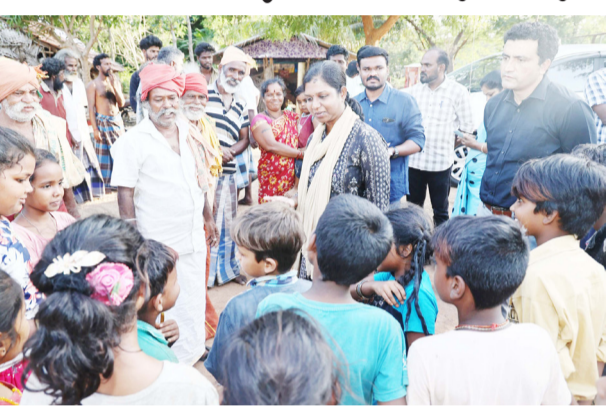
மேற்கொள்ள தொடர்புடைய அலுவலர்களுக்கு அறிவுறுத்தப்பட்டுள்ளது. மேலும், சக்கிரன் குண்டம் பகுதி மற்றும் கிரமங்கலம் பேரூராட்சி, அறிவொளி நகர் பகுதிகளில் உள்ள பள்ளி குழந்தைகள் சீராக பள்ளிக்கு சென்று கல்வி பயிலும் வகையிலும் உரிய நடவடிக்கைகளை மேற்கொள்ள அரசு அலுவலர்களுக்கு அறிவுறுத்தப்பட்டுள்ளது.

அவர்கள் தெரிவித்ததாவது தமிழக அரசு ஏழை, எளிய பொதுமக்கள் நல்வாழ்வு வாழ்ந்திடும் வகையில் பல்வேறு நடவடிக்கைகளை மேற்கொண்டு வருகிறது. அந்த வகையில் பொதுமக்களின் தேவைகளை அறிந்து, அவற்றை நிவர்த்தி செய்து கொடுப்பதே உரிய நடவடிக்கைகள் மேற்கொள்ளப்பட்டு வருகிறது. அந்த வகையில், ஆலங்குடி வட்டம், புனிச்சங்காடு கிராமம், சக்கிரன் குண்டம் பகுதிகளில் 60 குடும்பங்கள் வசித்து வருகின்றனர். இவர்களில் 38 குடும்பங்களுக்கு வீட்டுமனைப் பட்டாக்கள் வழங்கப்பட்டுள்ளது. மீதமுள்ள 22 குடும்பங்களுக்கு வீட்டுமனைப் பட்டாக்கள் வழங்குவதற்கு உரிய நடவடிக்கைகள்