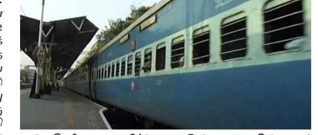
கூட்டுநெரிசலை தவிர்க்க ஏதுவாக அமையும். இவ்வாறு அதில் கூறப்பட்டுள்ளது.

திட்டமிடப்பட்டுள்ளது. இந்த சிறப்பு ரெயில்கள் மூலம் மொத்தம் 302 ரெயில் சேவைகள் இயக்கப்பட உள்ளது. இதேபோல, இந்திய ரெயில்வே துறைமூலம் இந்த ஆண்டு மொத்தம் 6 ஆயிரம் சிறப்பு ரெயில்கள் பல்வேறு பகுதிகளுக்கு இயக்க திட்டமிடப்பட்டுள்ளது. இதனால் விழா கால