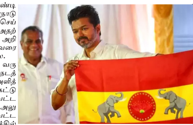
மாநாட்டை மிக பிரமாண்டமாக நடத்த பல்வேறு கெடுபிடி போடப்பட்டதால், அதற்கான பணிகள் தொடங்காமல் உள்ளது. மேலும் 23

சென்னை, செப். 18 தமிழ்திரையுலகின் முன்னணி நடிகர் விஜய், கடந்த பிப்ரவரி மாதம் தமிழக வெற்றிக் கழகம் என்ற அரசியல் கட்சியை தொடங்கினார். இதையடுத்து கடந்த ஆகஸ்டு 22ந்தேதி கட்சியின் கொடியை நடிகர் விஜய் அறிமுகப்படுத்தி, முதல் மாநாட்டில் கட்சியின் கொள்கை, கொடியின் விளக்கம், கட்சியின் நிலைப்பாடுகள் குறித்து விளக்குவதாக அறிவித்தார். இது விஜய் கட்சியின் தொண்டர்கள் மற்றும் ரசிகர்களிடம் உற்சாகத்தை ஏற்படுத்தியது. இதைத் தொடர்ந்து சேலம், திருச்சி உள்ளிட்ட சில இடங்களில் கட்சியின் மூத்த நிர்வாகிகள் மாநாடு நடத்துவதற்கான இடத்தை பார்வையிட்டனர். இதையடுத்து விழுப்புரம் மாவட்டம் விக்ரவாண்டி வி.சாலையில் மாநாடு நடத்த இடம் தேர்வு செய்யப்பட்டது. ஆனால் அதற்கான அதிகாரப்பூர்வ அறிவிப்பு இதுவரை அறிவிக்கப்படவில்லை. அதனை தொடர்ந்து வருகிற 23ந்தேதி மாநாடு நடத்துவதற்கு பாதுகாப்பு அளித்திட அனுமதி கேட்டு விழுப்புரம் மாவட்ட போலீஸ் சூப்பிரண்டு அலுவலகம் மற்றும் மாவட்ட கலெக்டர் அலுவலகத்தில் மனு அளிக்கப்பட்டது. இதையடுத்து 33நிபந்தனைகளுடன் மாநாட்டுக்கு அனுமதி வழங்கப்பட்டது. இதற்கிடையில் முதல்