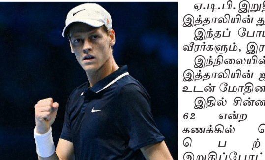
இன்று இரவு நடைபெறும் இறுதிப்போட்டியில் சின்னர், அமெரிக்காவின் டெய்லர் பிரிட்சுடன் மோதுகிறார்.

ஏ.டி.பி. இறுதிச்சுற்று எனப்படும் ஆண்கள் டென்னிஸ் சாம்பியன்ஷிப் போட்டி இத்தாலியின் துரின் நகரில் கடந்த 10ம் தேதி தொடங்கி நடந்து வருகிறது. இந்தப் போட்டியில் ஒற்றையரில் தரவரிசையில் முதல் 8 இடத்தில் உள்ள வீரர்களும், இரட்டையர் பிரிவில் டாப் 8 ஜோடியினரும் பங்கேற்றனர். இந்நிலையில், ஆண்கள் ஒற்றையர் பிரிவு அரையிறுதியில் நம்பர் 1 வீரரான இத்தாலியின் ஜானிக் சின்னர், 6வது நிலை வீரரான நார்வேயின் கால்பர் ரூட் உடன் மோதினார். இதில் சின்னர் 61, 62 என்ற செக் கணக்கில் வெற்றி பெற்று இறுதிப்போட்டிக்கு முன்னேறினார். இறுதிப்போட்டியில் சின்னர், அமெரிக்காவின் டெய்லர் பிரிட்சுடன் மோதுகிறார்.