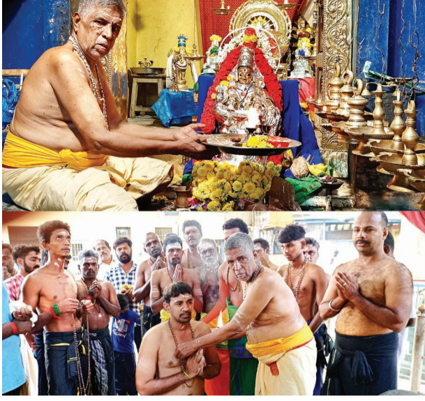
ஜோதியைக் காண பலரும் செல்வார். அதுவரை தினமும் காலை, மாலை வேலை களில் குளித்து சரண கோஷம் சொல்லி, ஜயப்பனை வணங்கி விரதம் மேற்கொள்கிறார்கள். சபரிமலைக்கு தரிசுப்பதில் இருந்துதான் அதிகமான பக்தர்கள் செல்கின்றனர்.

அணிந்து கொண்டு சுவாமியை தரிசனம் செய்தனர் இதே போன்று நகரில் திருவப்பூர் ஸ்ரீ முத்து மாரியம்மன் கோவில், சீதபதி ஸ்ரீ கிருஷ்ண விநாயர் கோவில் தண்டாயுத பாணி திருக்கோவில் உள்ளிட்ட கோவில்களில் சபரி மலைக்குச் செல்லும் பக்தர்கள் விரதமாலை அணிந்து கொண்டனர். சபரி மலை ஜயப்பன் கோயிலுக்கு ஆண்டுதோறும் பல்லாயிரக்கணக்கான பக்தர்கள் விரதமிருந்து செல்கின்றனர். இதற்காக, காந்திக்கை முதல் நாளில் மலை அணிந்து விரதத்தை தொடங்குகின்றனர். ஒரு மண்டலம் விரதம் மேற்கொண்டு, மகர