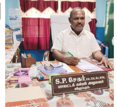
பின் நிர்வாகிகள் நேரில் சந்தித்து வாழ்த்து தெரிவித்தனர்.

கல்வி மாவட்ட ஜே.ஆர்.சி கன்வீனராகவும் சிறப்புடன் பணிபுரிந்துள்ளார். இன்று பணியேற்ற அவரை தலைமை ஆசிரியர் சான்றோர்கள் பட்டதாரி மற்றும் முதலமைச்சர் பட்டதாரி ஆசிரியர்கள் முதன்மை கல்வி அலுவலர்கள் மற்றும் மாவட்ட கல்வி அலுவலர்கள், மாநில, மாவட்ட ஆசிரியர் சங்க நிர்வாகிகள், ஜே.ஆர்.சி அமைப்பு