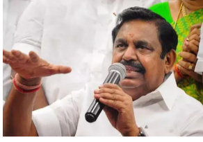
210 நீர்நிலைகளில், 140 நீர்நிலைகள் தூர்வாருதல் மற்றும் புனரமைப்புப் பணிகள் மேற்கொள்ளப்பட்டன. 48 கி.மீ. நீளமுள்ள 30 நீர்வரத்துக் கால்வாய்கள் தூய்மைப்படுத்தப்பட்டன. ரொபோடிக் என்சு வேட்டர், மினி ஆம்பிபியன் வாசனங்கள் புதிதாக வாங்கப்பட்டு சென்னை மாநகராட்சி முழுவதும் தூர்வாருதல் பணிகள், தூய்மைப் பணிகள் நடைபெற்றன. எங்களது ஆட்சியில் இப்பணிகள் முழுமையாக நடைபெற்று வருகின்றன.

ளுக்கு ஏற்ப தூய்மைப் பணிகளை மேற்கொள்ளாததன் காரணமாக இன்று சென்னை மாநகராட்சி அகில இந்திய அளவில் எடுக்கப்பட்ட சர்வேயின் படி, இந்த ஆண்டு 199வது இடத்தைப் பிடித்துள்ளதாக நானிதழ்களிலும், ஊடகங்களிலும் செய்திகள் வந்துள்ளன. இதன்மூலம் அ.தி.மு.க. அரசும், துறை அமைச்சர்களும், மாநகராட்சி மேயரும் வாசிச்சொல் வீரர்களாகத்தான் இருக்கிறார்களே தவிர, எந்த நலத்திட்டங்களையும் நிறைவேற்றாதது அம்பலமாகியுள்ளது. பருவ மழைக்காலங்களில் சென்னை மாநகராட்சிக்கு உட்பட்ட பகுதிகளில் அதிக அளவில் வெள்ள நீர் தேங்கியிருந்த நிலையில், 2020ம் ஆண்டில் அந்த இடங்கள் பெருமளவு குறைக்கப்பட்டது. அப்போது, சென்னையில்