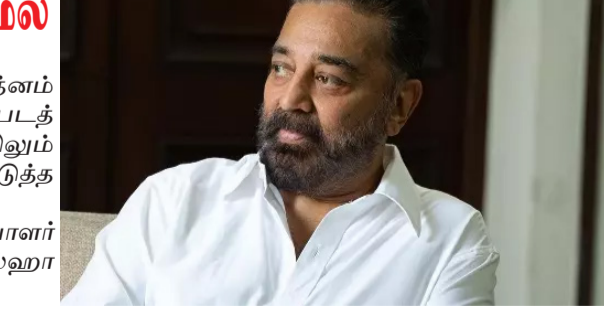
கமல்ஹாசன் 'இந்தியன் 2' படத்துக்கு பிறகு மணிரத்னம் இயக்கத்தில் 'தக்லைப்' படத்தில் நடித்து வந்தார். இந்த படத்தின் படப்பிடிப்பு முடிந்துள்ளது. இந்தியன் 3ம் பாகத்திலும் நடித்து முடித்துள்ளார். இந்த இரண்டு படங்களும் அடுத்தடுத்து திரைக்கு வர உள்ளன. இந்த நிலையில் அடுத்த பிரபல சண்டைப் பயிற்சியாளர் கள் அன்புறிவு சகோதரர்கள் இயக்கும் படத்தில் கமல்ஹாசன் நடிக்க இருக்கிறார். இந்த படம் குறித்து ஏற்கனவே அறிவிப்பு வெளியான நிலையிலும் பட வேலைகள் தொடங்காமல் இருந்தது. இந்த நிலையில் கமல்ஹாசன் நடிக்கும் 237வது படத்தின் படப்பிடிப்பு ஜனவரி மாதம் தொடங்கும் என்று தெரிவித்து உள்ளனர். இந்த படத்தில் நடிக்கும் இதர நடிகர் நடிகை மற்றும் தொழில்நுட்ப கலைஞர்கள் விவரம் விரைவில் அறிவிக்கப்பட உள்ளது. சண்டை பயிற்சி இயக்குனர்கள் இயக்குவதால் இது முழுநீள அதிரடி சண்டை படமாக இருக்கும் என்று கூறப்படுகிறது. இந்த படத்தில் நடிக்க கமல்ஹாசன் கடும் உடற்பயிற்சிகள் செய்து முழுமையாக தன்னை தயார்படுத்தி வருகிறார்.