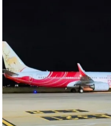
பாதுகாப்பு கருதி முன்னெச்சரிக்கை நடவடிக்கையாக ஏராளமான விமான நிலையங்களில் விமானம் தரையிறங்கப்பட்டது. திருச்சியில் இருந்து இன்று மாலை சுமார் 141 பயணிகள் மற்றும் விமான பணியாளர்களுடன் ஐக்கிய அரபு எமிரேட்ஸின் சார்ஜாவுக்கு ஏர் இந்தியா விமானம் புறப்பட்டு சென்றது. சுமார் 2.40 மணிக்கு விமானம் ஒருதளத்திலிருந்து வானில் புறந் நிலையில் திடீரென தொழில்நுட்ப கோளாறு ஏற்பட்டது.

திருச்சி, அக். 12 லேண்டிங் கியரில் ஏற்பட்ட தொழில்நுட்ப கோளாறு காரணமாக திருச்சி புதுக்கோட்டை எல்லைப் பகுதியில் சுமார் 2 மணி நேரத்திற்கு மேலாக வட்டமிட்ட ஏர் இந்தியா ஏஎக்ஸ்பி 613 விமானம் திருச்சியில் பத்திரமாக தரையிறங்கப்பட்டது. இந்தநிலையில் விமானம் பத்திரமாக தரையிறங்கியதைக் கேள்விப்பட்ட மனம் நெகிழ்ந்ததாக தமிழக முதல்வரை மு.க.ஸ்டாலின் கூறியுள்ளார். திருச்சியில் இருந்து இன்று மாலை சுமார் 141 பயணிகள் மற்றும் விமானி உள்ளிட்ட விமான பணியாளர்களுடன் ஐக்கிய அரபு எமிரேட்ஸின் சார்ஜாவுக்கு ஏர் இந்தியா விமானம் புறப்பட்டு சென்றது. சுமார் 2.40 மணிக்கு விமானம் ஒருதளத்திலிருந்து வானில் புறந் நிலையில் திடீரென தொழில்நுட்ப கோளாறு ஏற்பட்டது.