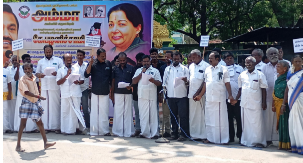
னிச்சாமி, தனபால், மாபெரும் மனித இளங்கோவன், ஆகி சங்கிலி போராட்டம் யோர் தலைமையில் நடைபெற்றது.

விழுப்புரம், அக். 10 விழுப்புரம் மாவட்டம் அறங்கண்டநல்லூர் பேருராட்சியில் அதிமுக சார்பில் 40 மாத காலமாக தமிழக மக்கள் பல்வேறு இன்னல்களைவருவதற்கு காரணமான திமுக அரசை கண்டித்தும் மக்கள் நலன் கருதி உயர்த்தப்பட்ட சொத்து வரியை உடனடியாக திரும்பப் பெற வலியுறுத்தியும் அதிமுக முகையூர் ஒன்றிய செயலாளர்கள் பழ