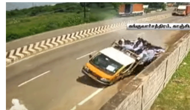
மாக 13 பேரை ஏற்றியதாக கூறப்படுகிறது. இந்நிலையில் அந்த மினி வேன் வாகனம் சாம்சங் தொழிற்சாலை அருகே வரும் பொழுது அதன் டிரைவர் வாகனத்தை மிகவும் வேகமாக தாறுமாறாக இயக்கியுள்ளார். அப்பொழுது சாம்சங் நிறுவனத்தின் தடுப்பு சுவரில் மோதி மினி வேன் வாகனம் கவிழ்ந்து விபத்துக்குள்ளானது.

காஞ்சிபுரம், அக் 10 காஞ்சிபுரம் மாவட்டம் சுங்குவாச்சத்திரம் அடுத்த எச்சூர் பகுதியில் சாம்சங் தொழிலாளர்கள் தொடர்ந்து பல்வேறு கோரிக்கைகளை வலியுறுத்தி 30 நாட்களாக போராட்டம் நடத்தி வருகின்றனர். இந்நிலையில் போராட்டத்திற்கு வரும் ஊழியர்கள் சுங்குவாச்சத்திரம் அருகே நடந்து வந்து கொண்டிருந்த பொழுது அவ்வழியாக வந்த மினி வேன் டிரைவர் நான் அந்த வழியாக தான் செல்கிறேன் நீங்கள் வருகிறீர்களா என்று கேட்டு வலுக்கட்டாய