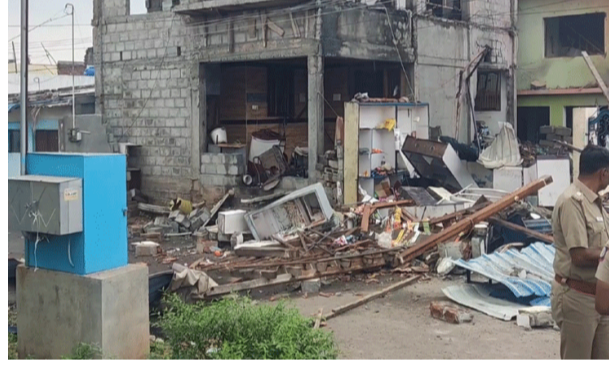
இந்த சம்பவத்தில் அருகில் இருந்தவர்கள் படுகாயம் அடைந்தனர். அவர்களுக்கு முதலுதவி சிகிச்சை அளிக்கப்பட்டது. இதனிடையே இந்த வெடி விபத்தில் சிக்கி ஒருவர் உடல் சிதறி உயிரிழந்ததாக தகவல் தெரிவிக்கப்பட்டிருந்தது. இந்நிலையில் நாட்டு வெடிகுண்டு வெடித்து விபத்தில் சிக்கி மூன்று பேர் உயிரிழந்துள்ளதாக தகவல் வெளியாகி உள்ளது. 9 மாத முற்படை, பெண் ஒருவர் உயிரிழந்த நிலையில், சிகிச்சை