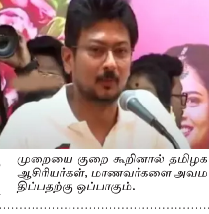
முறையை குறை கூறினால் தமிழக ஆசிரியர்கள், மாணவர்களை அவமதிப்பதற்கு ஒப்பாகும்.

கல்விஞ்ஞானிகளாகவும், மிகப்பெரிய மருத்துவராகவும் உள்ளனர். * சில வயிற்றொரிச்சல் பிடித்தவர்கள் இதை ஏற்க முடியாமல் தான் மாநில அரசின் கொள்கை மீது குற்றம் சொல்கிறார்கள். * ஆசிரியர் பணி அறிவார்ந்த தலைமுறையை உருவாக்கும் பணி. * தமிழக பாடத்திட்டத்தை யார் குறை சொன்னாலும் அதை யார் குறை சொன்னாலும் ஏற்க முடியாது. * தமிழ்நாடு பாடத்திட்ட