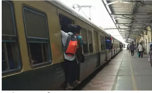
இவ்வாறு அதில் கூறப்பட்டுள்ளது.

சென்னை, செப். 7 தெற்கு ரெயில்வே வெளியிட்டுள்ள செய்திக்குறிப்பின்படி, விநாயகர் சதுர்த்தியை முன்னிட்டு, நாளை (7 ந்தேதி) பொது விடுமுறை என்பதால் மின்சார ரெயில்கள் ஞாயிற்றுக்கிழமை கால அட்டவணைப்படி இயக்கப்படும்.