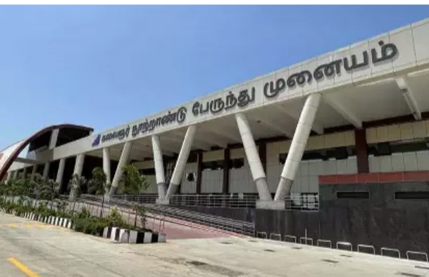
சென்னை, செப். 7

வில் பயணத்தை உறுதி செய்துள்ளனர். சென்னையில் இருந்து மட்டும் 10 ஆயிரம் பேர் முன்பதிவு செய்தனர். பல்வேறு நகரங்களில் இருந்து 27 ஆயிரம் பேரும், சென்னையில் இருந்து 15 ஆயிரம் பேரும் செல்ல திட்டமிட்டுள்ளனர். இதுகுறித்து அரசு விரைவு போக்குவரத்து கழக அதிகாரிகள் கூறும்போது, பண்டிகை மற்றும் வார விடுமுறை நாட்களை பொட்டி பொட்டிக்க வின் பயணம் அதிகரித்து உள்ளது. கூட்டத்தை சமாளிக்க தேவைக்கேற்ப கூடுதலாக சிறப்பு பஸ்களை ஏற்பாடு செய்து உள்ளோம். முன்பதிவு விறுவிறப்பாக நடந்து வருகிறது. கூட்ட நெரிசலை தவிர்க்க முன்பதிவு செய்து பயணத்தை தொடர கேட்டுக்கொள்கிறோம் என்றனர்.