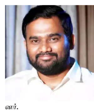
சென்னை, செப். 7