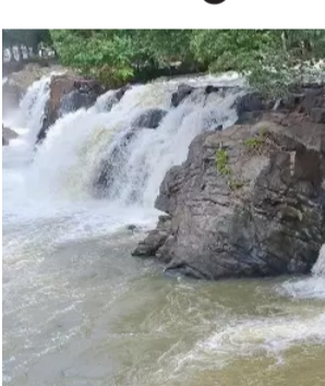
சென்னை, செப். 7

நீர்வரத்து அதிகரித்ததால் மெயின் அருவி, சினிபால்ஸ், ஐந்தருவி ஆகிய அருவிகளில் தண்ணீர் ஆர்ப்பரித்து கொட்டியது. இதேபோன்று காவிரி ஆற்றிலும் தண்ணீர் சீறி பாய்ந்து சென்றது. இந்த நீர்வரத்தை கர்நாடகா தமிழக எல்லையான பிலிகண்டிலு வில் மத்திய நீர்வளத்துறை அதிகாரிகள் தொடர்ந்து கண்காணித்து வருகின்றனர். ஓகேனக்கல் காவிரி ஆற்றில் நீர்வரத்து அதிகரிப்பதும் குறைவதுமாக உள்ளதால் அருவியில் குளிக்க விதிக்கப்பட்ட தடையாக தொடர்ந்து 5வது நாளாக நீடிக்கிறது.