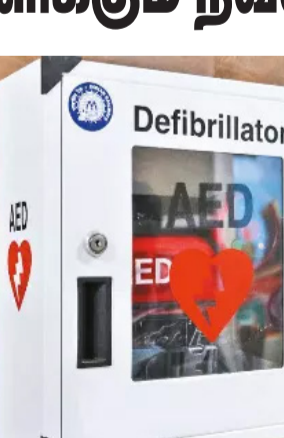
சென்னை, செப். 7