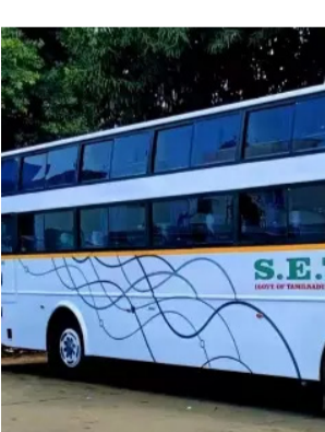
சென்னை, செப். 7

வதற்காக முன்பதிவு தொடங்கியது. தென் மாவட்டங்களுக்கு செல்லக்கூடிய அனைத்து பஸ்களும் நிரம்பி விட்டன. அதே போல பண்டிகை முடிந்து நவம்பர் 3ந் தேதி (ஞாயிற்றுக்கிழமை) அங்கிருந்து புறப்பட்டு சென்னைக்கு வருவதற்கும் பெரும்பாலான இடங்கள் நிரம்பி விட்டன. 1500 பஸ்களுக்கு முதல் கட்டமாக முன்பதிவு நடந்து வருகிறது. இதுதவிர வழக்கம் போல சிறப்பு பஸ்களும் அறிவிக்கப்படும்.