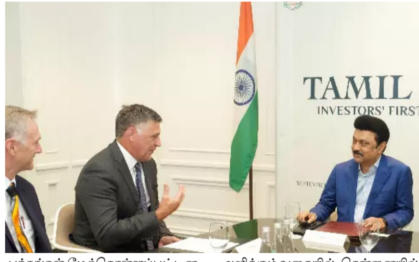
பந்தங்கள் மேற்கொள்ளப்பட்டன. ஈட்டன் நிறுவனத்திற்கும், தமிழ் நாடு அரசிற்கும் இடையே முதலமைச்சர் மு.க.ஸ்டாலின் முன்னிலையில் ரூ.200 கோடி முதலீட்டில் 500 பேருக்கு வேலைவாய்ப்பு

சான்பிரான்சிஸ்கோ, செப். 7 வளர்ச்சியின் அடையாளமாக திகழும் தொழில் நிறுவனங்கள், தமிழ் நாட்டில் அதிக அளவில் முதலீடு செய்யும் வகையிலும், இளைஞர்களுக்கு அதிக எண்ணிக்கையிலான வேலைவாய்ப்புகளை உருவாக்கவும் முதலமைச்சர் மு.க.ஸ்டாலின் அமெரிக்க நாட்டிற்கு அரசு முறைப் பயணம் மேற்கொண்டு வருகிறார். சான்பிரான்சிஸ்கோவில் உலகின் முன்னணி தொழில் நிறுவனங்களுடன் புரிந்துணர்வு ஒப்பந்தமும் மேற்கொள்ளப்பட்டன, இதன்மூலம் மொத்தம் ரூ.1,300 கோடி முதலீட்டில் 4,600 நபர்களுக்கு வேலைவாய்ப்பு அளிக்கும் வகையில் புரிந்துணர்வு ஒப்பந்தங்கள் மேற்கொள்ளப்பட்டுள்ளது. கடந்த 3ந் தேதியன்று அமெரிக்க நாட்டின் சிகாகோ நகரில் ஈட்டன் மற்றும் அஷ்யூரன்ட் நிறுவனங்களுடன் முதலமைச்சர் முன்னிலையில் புரிந்துணர்வு ஒப்பந்தங்கள் மேற்கொள்ளப்பட்டன. ஈட்டன் நிறுவனத்திற்கும், தமிழ் நாடு அரசிற்கும் இடையே முதலமைச்சர் மு.க.ஸ்டாலின் முன்னிலையில் ரூ.200 கோடி முதலீட்டில் 500 பேருக்கு வேலைவாய்ப்பு