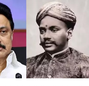
சென்னை, செப். 7

சென்னை, செப். 7 கப்பலோட்டிய தமிழன் வ.உ.சி.தம்பரனாரின் பிறந்த தினம் இன்று கொண்டாடப்படுகிறது. இதை யொட்டி முதலமைச்சர் மு.க.ஸ்டாலின் தனது அலுவலகத்தில், ஆங்கிலேயரின் பொருளாதாரச் சரணடலுக்கு எதி